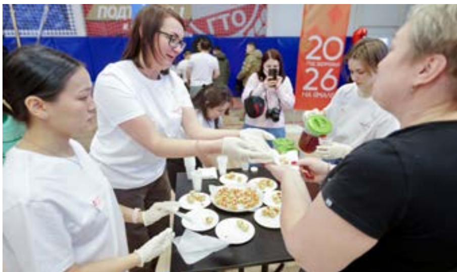
Специалисты Дома творчества угощали северными десертами