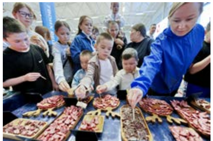
Тазовскую колбасу делают из экологически чистой оленины

Открытие Года здоровья завершилось ярко и полезно. Организаторы надеются, что мероприятие мотивирует тазовчан внимательнее относиться к своему здоровью, вести активный образ жизни и заботиться о себе и своих близких.