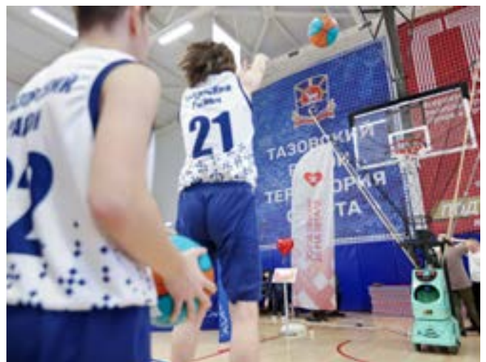
Робот-тренажёр помогает баскетболистам