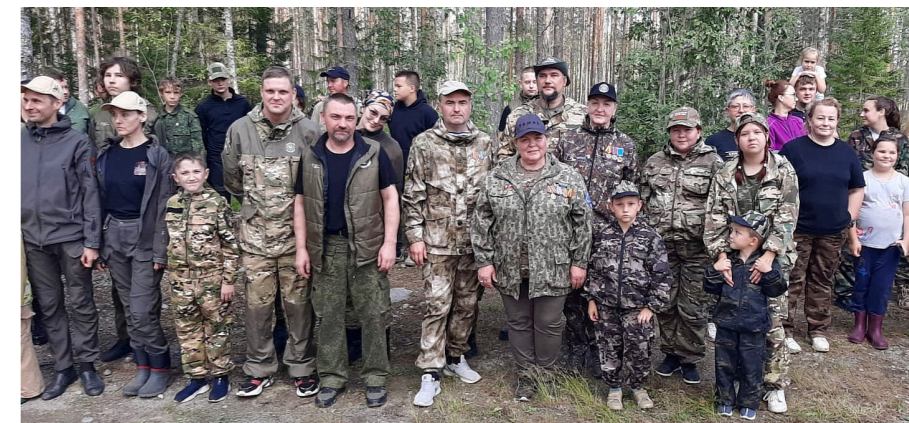
В межрегиональной поисковой экспедиции «Суоярвский плацдарм» в Карелии участвовали три ямальских отряда

На сентябрь окружным Департаментом молодёжной политики запланирована культурно-познавательная поездка в Севастополь. В ней примут участие в том числе и молодые поисковики со всего Ямала - 18 человек. Чтобы поехать в город-герой, ребятам нужно активно участвовать в жизни поискового отряда.