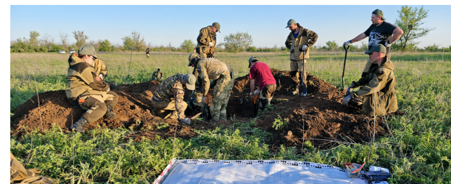
Тазовский отряд «Семидесятая весна» в апреле-мае участвовал в поисковой экспедиции «Донской фронт»