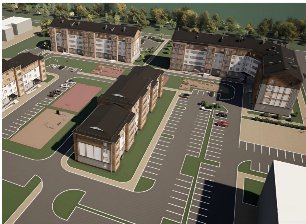
Дизайн-проект арендных домов в п. Харп

В стадии строительства находятся три многоквартирных дома в Тарко-Сале и Харпе. Ещё один дом в скором времени начнут возводить в Лабитнанги