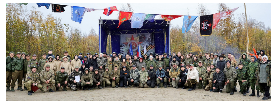
В сентябре 2025 года в посёлке Уренгой прошёл XVII Окружной слёт поисковых отрядов