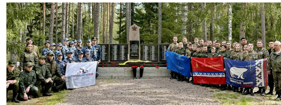
Ноябрьский поисковый отряд «Виталис» весной ездил в поисковую экспедицию в Ленинградскую область