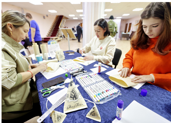
Гости форума попробовали себя в творчестве и расписали подарочный пакет

- Без активного гражданского общества, которое участвует во всех процессах, невозможно достижение высоких результатов. Премии - это не столько поощрение, сколько