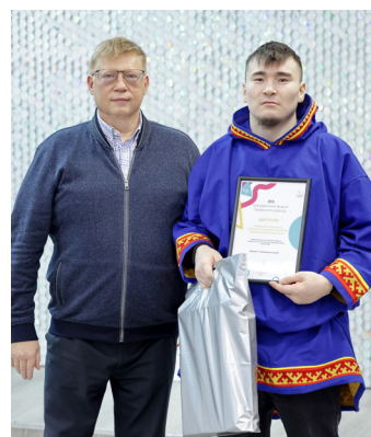
Территориально-соседская община КМНС «Ямал ЕРВ» с проектом «Северная сила» получила грант на проведение тренировок и турнира по нацвидам для гостей на День оленевода