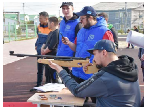
Стрельба из пневматической винтовки оказалась одним из сложных испытаний

Добавим, что мероприятия проходили под эгидой федерального проекта «Спорт - норма жизни», реализуемого в рамках национального проекта «Демография».