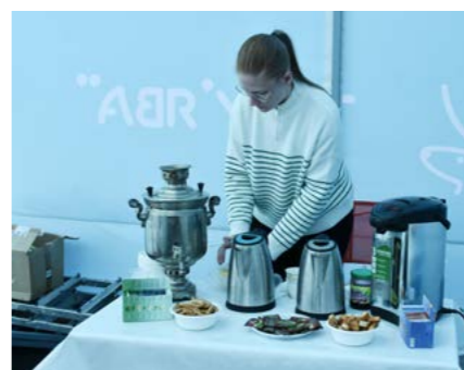
Участники смогли продегустировать вкусный чай с северными травами