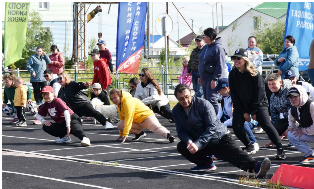
Перед сдачей нормативов на стадионе с участниками ГТО провели массовую зарядку

Праздник. В минувшую субботу, 10 августа, в России отметили День физкультурника. Представители тазовских трудовых коллективов в этот день сдавали нормативы ГТО