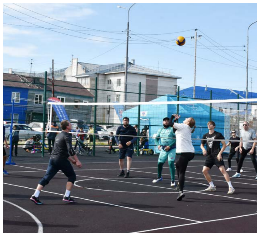
Две сборные команды боролись за первое место в волейболе