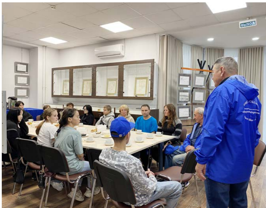
Участники просветительской экспедиции встретились со школьниками

Туризм. 450 лет назад, после указа Ивана Грозного, началось освоение Сибири. Так, в 1586 году появилась Тюмень, потом до конца XVI века были основаны Тара, Тобольск, Туринск, Мангазея и Обдорск