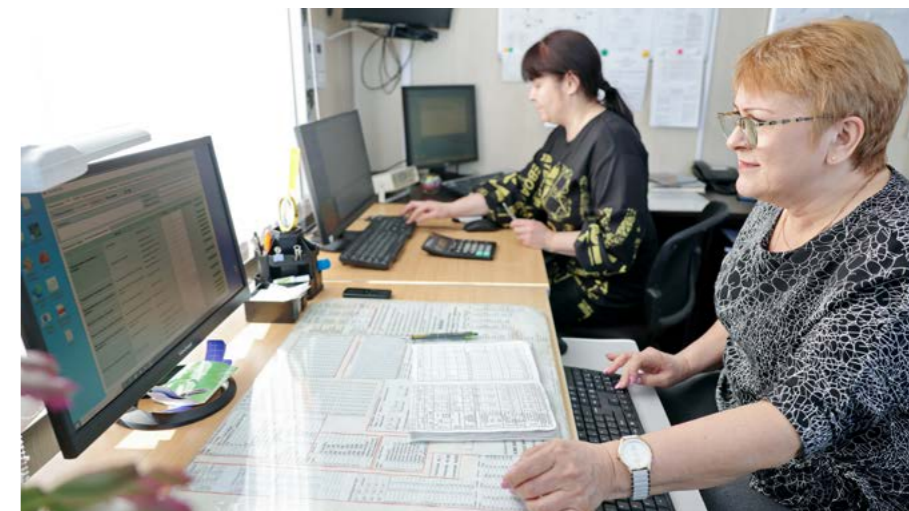
На техника-метеоролога возложена серьёзная миссия: непрерывный контроль за программным обеспечением, наблюдение за природными явлениями и фиксация данных

Несмотря на наступление календарной весны, морозы не спешат покидать территорию Крайнего Севера. По данным синоптиков, конец марта выдастся морозным. Потепление ожидается в апреле, где среднемесячная температура составит от -5 до -12°C.