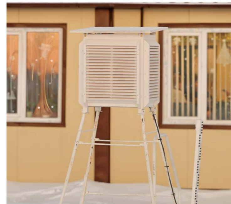
Метеорологическая будка - конструкция из жалюзийных стенок, в которой размещаются приборы, требующие защиты от действия атмосферных осадков, прямых солнечных лучей и порывов ветра