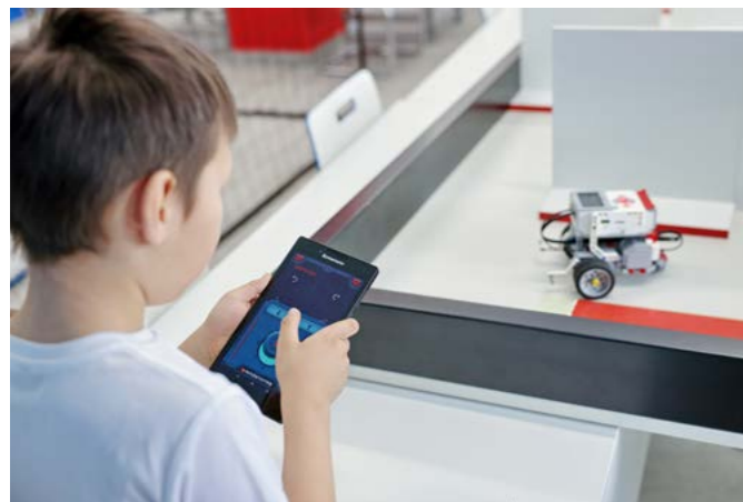
Одна из номинаций - прохождение лабиринта на время с помощью дистанционного управления

Развитие. Познать язык программирования и подружиться с LEGO-другом: 17 марта на базе класса точных наук Тазовской школы-интерната прошли III районные соревнования по робототехнике «Роботур» среди обучающихся 1-9-х классов. Участие приняли 5 команд из образовательных учреждений Тазовского и Газ-Сале