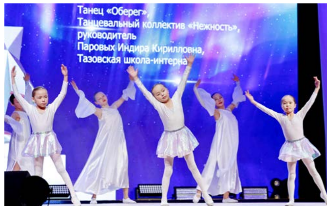
Танец «Оберег» в исполнении коллектива «Нежность» Тазовской школы-интерната до слёз тронул членов жюри и принёс девушкам диплом первой степени

Юбилей. В районном Доме культуры состоялся юбилейный районный конкурс художественного творчества «Полярная звезда». Больше сотни юных артистов подарили зрителям и жюри два часа праздника