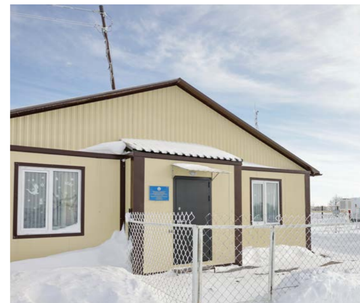
3 года назад благодаря федеральной программе развития Арктической зоны РФ сотрудники метеостанции переехали из аварийной постройки в новое здание, оснащённое современным оборудованием