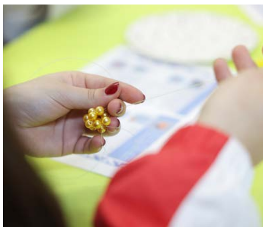
После угощения десертами с северными ягодами, гостей пригласили на мастер-класс. Под руководством педагога Дома творчества школьники и взрослые смастерили брошки с моршшкой