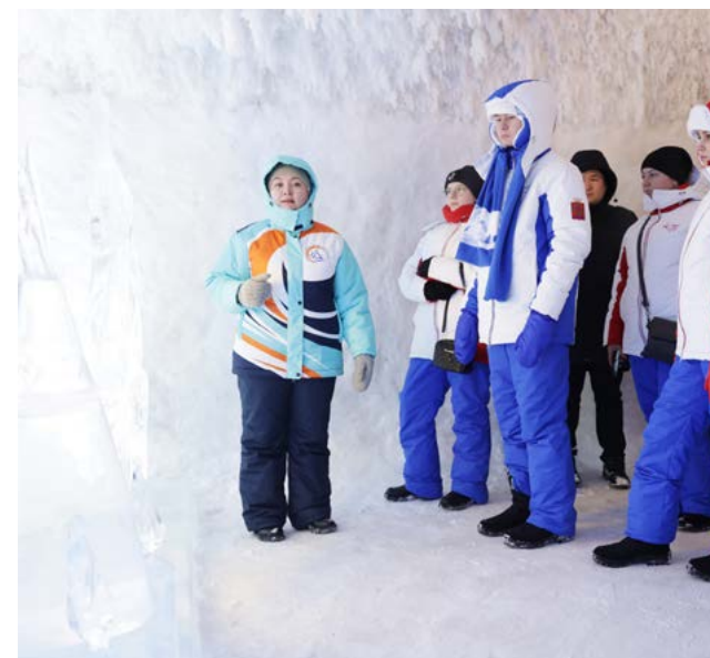
Гости из Волновахи побывали в Музее вечной мерзлоты