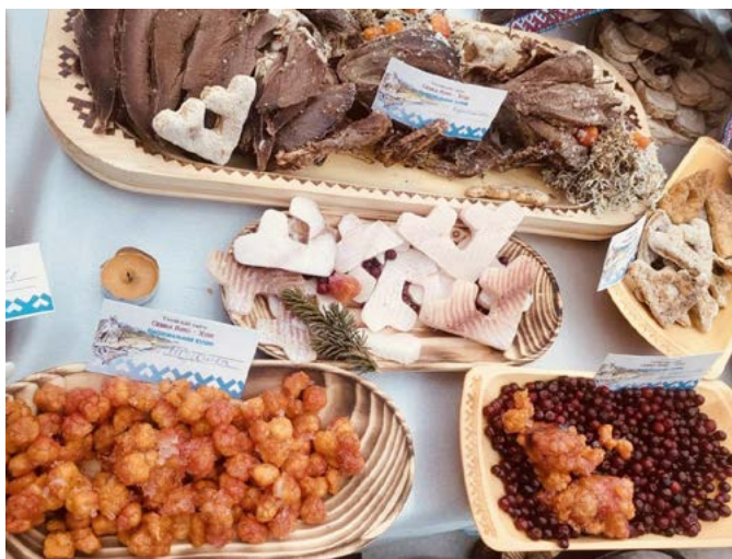
Тазовская семья удивила гостей необычной подачей блюд: рыбная строганина в виде ненецкого орнамента и фигурные лепёшки из икры

ОЛЬГА РОМАХ