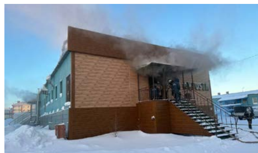
Пожар в здании ресторана «В гости», п. Тазовский

12 и 13 февраля на территории района произошло два пожара: один из них - в жилом секторе