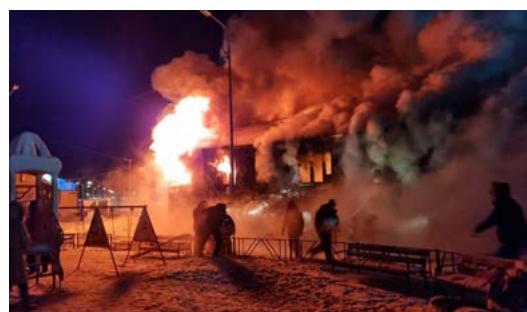
Пожар в жилом доме в Антипаюте по адресу: Советская, 19

13 февраля в 17:20 в ПЧ по охране Антипаюты поступило сообщение об открытом горении многоквартирного жилого дома, находящегося по адресу: ул. Советская, 19. Для ликвидации пожара были задействованы 18 человек личного состава и 3 единицы спецтехники. Огнём повреждён дом на площади 300 кв. м, пострадал 1 человек (порезы пальцев кисти, в госпитализации не нуждается). Причина пожара и ущерб устанавливаются.