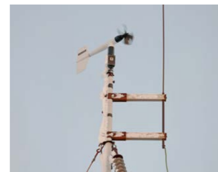
Тазовская авиационная метеорологическая станция работает круглосуточно и без выходных

Специалисты метеорологической станции ведут самый главный документ - дневник погоды для авиации, а также книгу климатических наблюдений, в которую вносятся все измерения за каждый день. Вся информация, касающаяся погоды, передаётся в Московскую базу данных, а после этого синоптики из Нового Уренгоя составляют прогноз.