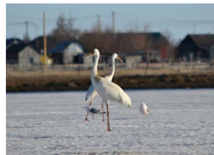
В книге представлено 153 вида животных, растений и грибов. Первый тираж составил 100 экземпляров

Часть книг передана в Российскую государственную библиотеку. Их разошлют в главные библиотеки и учреждения округа, а также в другие регионы. Издание доступно в электронной версии.