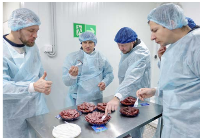
Одним из пунктов деловой поездки стало посещение цеха переработки оленины в СПК «Тазовский». Гостей интересовало всё - от формы организации до реализации готовой продукции