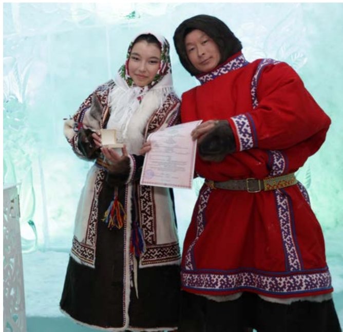
Одна из возможных локаций для торжественного бракосочетания - Музей вечной мерзлоты

Юбилей. В 1994 году был создан Тазовский районный краеведческий музей. В этом году 1 января ему исполнилось 30 лет