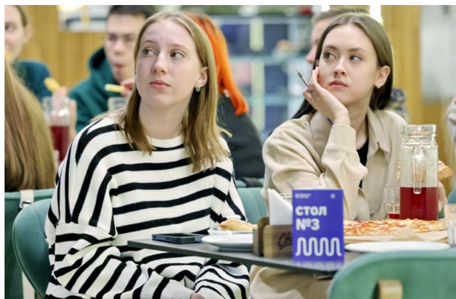
Топ-квиз - прекрасный вариант для весёлого времяпрепровождения школьников, студентов или компании молодёжи

Досуг. Зажигательная музыка, вкусная еда и новые знакомства: 12 января в одном из кафе райцентра прошло развлекательное мероприятие «Очень Новый год», приуроченное к празднованию Старого Нового года. Встречу организовали сотрудники Молодёжного центра