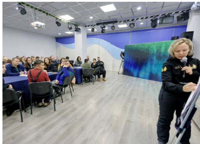
Завершением стала итоговая сессия, на которой представители администрации, местные и липецкие бизнесмены обсудили перспективы развития туризма