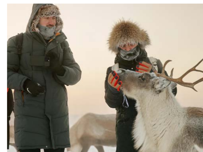
Третий день пребывания на Тазовской земле липчане провели в настоящем стойбище, где познакомиться с традициями и бытом коренных жителей и отведали традиционные блюда