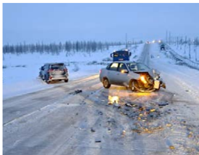
8 февраля около 8 часов утра на автодороге Коротчаево - Тазовский произошло столкновение двух транспортных средств

ДИЛЯРА ЮМАШЕВА, ИНСТРУКТОР ГРУППЫ ПРОФИЛАКТИКИ ПОЖАРОВ ОПС ЯНАО ПО ТАЗОВСКОМУ РАЙОНУ