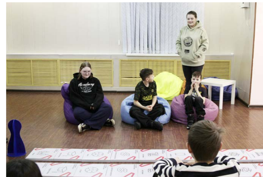
Игру «10 граней патриотизма» организовали для ребят в рамках месячника оборонно-массовой и спортивной работы, посвящённого Дню защитника Отечества

Игру «10 граней патриотизма» организовали для ребят в рамках месячника оборонно-массовой и спортивной работы, посвящённого Дню защитника Отечества. В этом же месяце работники СДК проводили для детей в школе информационно-просветительскую программу о блокаде Ленинграда. Сегодня, 15 февраля, для шестиклассников Газ-Салинской школы пройдёт урок о воинах-интернационалистах.