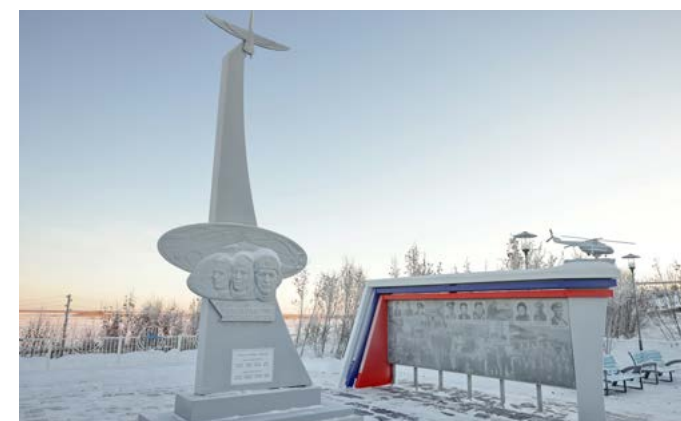
АНАСТАСИЯ РОМАНОВА РОМАН ИЩЕНКО (ФОТО)

Экскурсия. 24 ноября сотрудники районной библиотеки провели литературное рандеву «От стелы до сквера» для многодетных мам и тех, чьи дети добиваются особых успехов в учёбе, спорте и творчестве