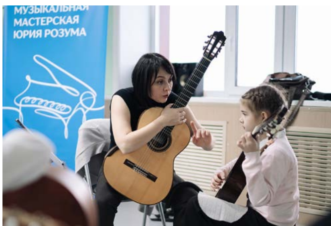
ВАЛЕРИЯ КОВАЛЁВА ФОТО АВТОРА

Народный артист России Юрий Розум и команда знаменитых музыкантов посетили Тазовскую школу искусств и поделились своим опытом с воспитанниками и педагогами.