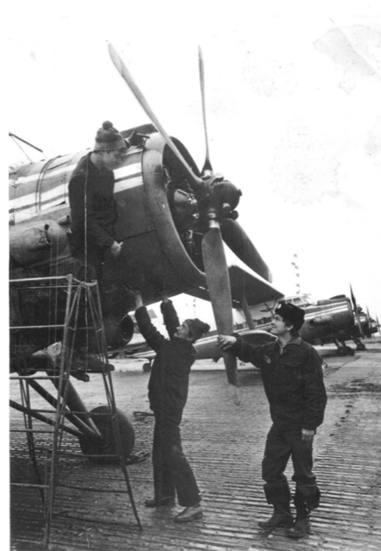
Эскадрилья самолетов Ан-2, 1970-е годы

Без активного участия авиации невозможно представить себе разведку полезных ископаемых, строительство важнейших пусковых строек Севера. Авиация перевезла тысячи пассажиров, перебрасывала тысячи тонн различных грузов для обеспечения промысловиков и рыбаков, разведчиков недр. Советские полярные летчики оказывали существен-