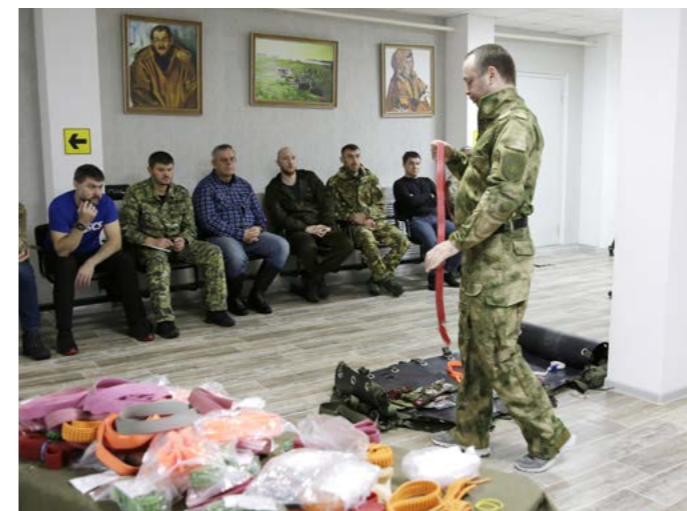
В арсенале санинструктора несколько разных кровоостанавливающих жгутов. На курсах речь шла в том числе о них и о том, чем должны быть наполнены аптечки

Стоит отметить, что семейно-родовые общины также являются некоммерческими организациями и тоже могут подать заявку на участие в конкурсе грантов. Размеры грантов - от 500 тысяч до 5 миллионов рублей. При этом одна организация может получить не более двух грантов на общую сумму не более 5 миллионов рублей.