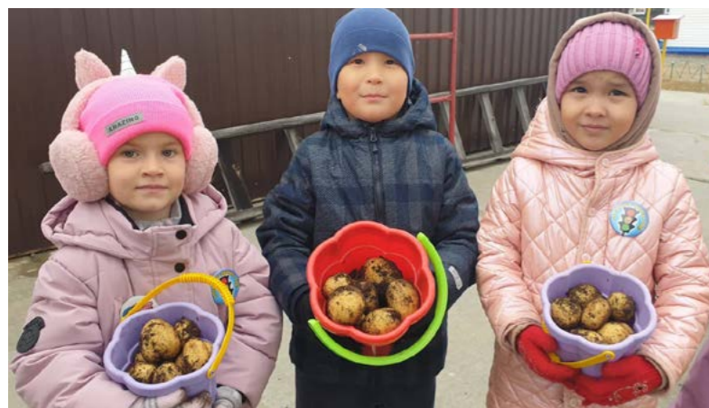
В рамках проекта ребята собрали собственноручно выращенный урожай овощей и фруктов

Воспитание. В детском саду «Солнышко» продолжают обучать детей экovolонтерству в рамках проекта «Маленький след на огромной планете», который реализуется на средства гранта ПАО «ЛУКОЙЛ»