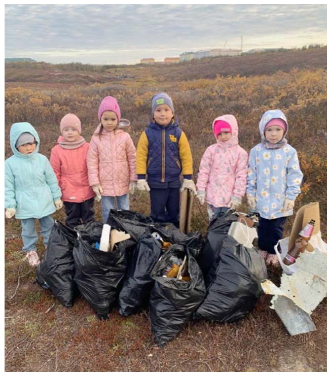
Воспитанники детского сада «Солнышко» принимают активное участие в различных экологических акциях