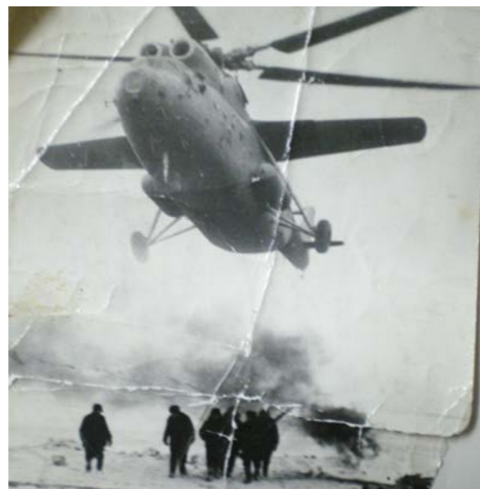
На вахту. Взлёт Ми-6, 1971 год.

ПРОДОЛЖЕНИЕ. НАЧАЛО ЧИТАЙТЕ В ПРЕДЫДУЩЕМ НОМЕРЕ