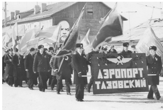
Работники Тазовского объединённого авиаотряда во время первомайской демонстрации несут транспортант, 1984 год