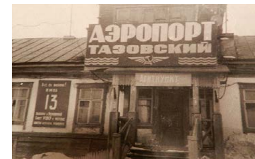
Фрагмент фасада служебного здания аэропорта в посёлке Тазовском, 1971 год

ки парусной рыбницей, от Находки до Нового Порта - теплоходом и от Нового Порта до Гыдоямю теплоходом «Микоян» - единственным северным рейсом. Зимой из Хальмер-Седэ в Гыдоямю можно было попасть исключительно оленьим транспортом.