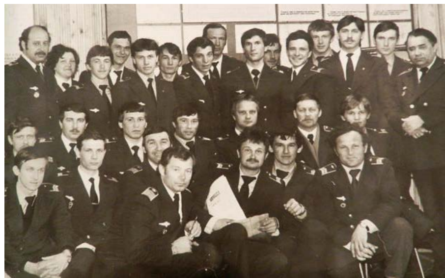
Эскадрилья Ан-2 Тазовского объединённого авиаотряда, 1984 год