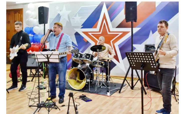
Группа «2x2» выступила с музыкальными композициями в поддержку будущих защитников