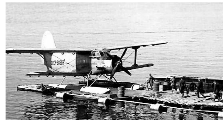
Ан-2 гидро-вариант, 1975 год