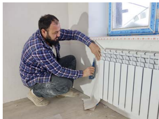
На каждом этаже бригады отделочников стелят линолеум, шпаклюют стены, клеят обои