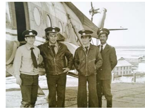
На взлётной полосе, 1980-е годы. Из семейного архива Агафоновых (Речаповых)

Путь следования от центра Тазовского района - поселка Хальмер-Седэ (далее, с 1949 года - Тазовский) - до конечного пункта Гыдоямю представлял сложность как в зимнее, так и в летнее время. Весной и осенью сообщение совершенно прерывалось на полтора месяца. Летом можно было попасть в Гыдоямю один раз в навигацию следующим путем: от поселка Хальмер-Седэ до Наход-