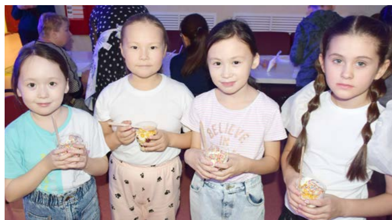
Трайфл - десерт, приготовленный собственноручно, - что может быть вкуснее?

Досуг. Живая музыка, плейбек-театр, мастер-классы, игры, фильмы и аромат свежесваренного кофе: этот вечер пятницы тазовчане ждали с нетерпением