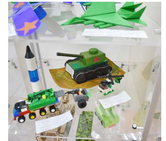
В РДК представлена выставка макетов военной техники «Техника в масштабе»