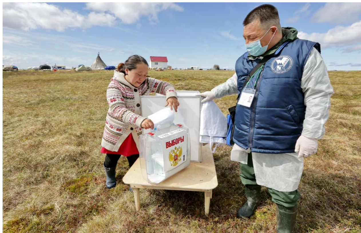
Избирательным участком в Тазовском районе могут стать и стойбище оленеводов, и рыболовецкие пески

Выборы. В этом году исполняется 30 лет избирательной системе Ямало-Ненецкого автономного округа. В Тазовском районе организацией и проведением выборных кампаний занимается Территориальная избирательная комиссия. На постоянной основе она начала работу в 2002 году