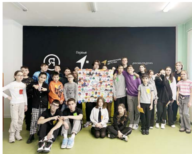
Ребята на мастер-классе по арт-педагогике украсили школьный стенд, посвящённый Дню народного единства

Каникулы. Квесты, квизы, мастер-классы, танцы и громкая музыка: так прошли каникулы у юных тазовчан. Осенние каникулы - это время, которое ждёт каждый школьник, а ученики Тазовской средней школы ждали их наступления с особым нетерпением