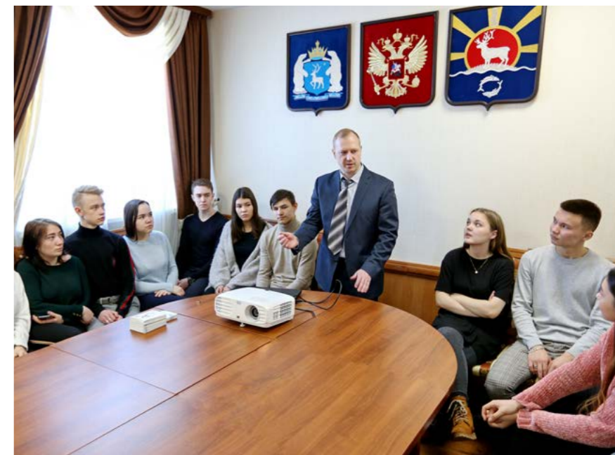
Школьники - всегда желанные гости в территориальном избиркоме

На территории Тазовского района также сформированы 8 постоянных участковых избирательных комиссий. В период проведения федеральных избирательных кампаний для реализации избирательных прав граждан Российской Федерации, находящихся в местах временного пребывания избирателей, дополнительно образуются избирательные участки на крупных нефтегазовых месторождениях. Например, в 2021 году к выборам депутатов Госдумы РФ восьмого созыва на территории Тазовского района было образовано 4 таких избирательных участка, а в 2023 году