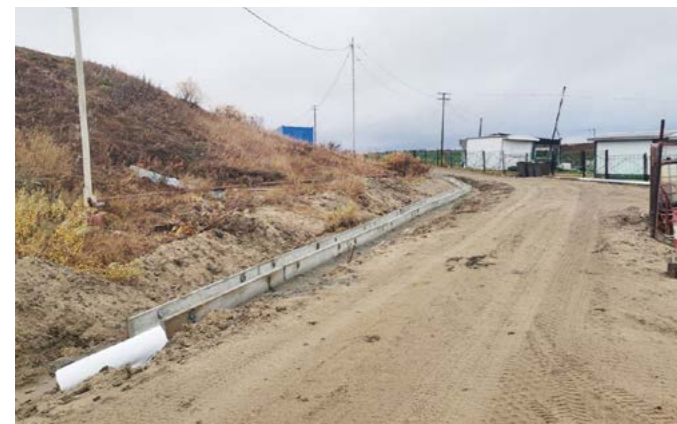
200 метров дороги в щебне и 163 метра водоотводных лотков вместо бездорожья. Летом в микрорайоне Школьном отремонтирован участок дороги

Итоги лета. В Находке завершается сезон благоустройства. По меркам маленького села работа проделана масштабная!