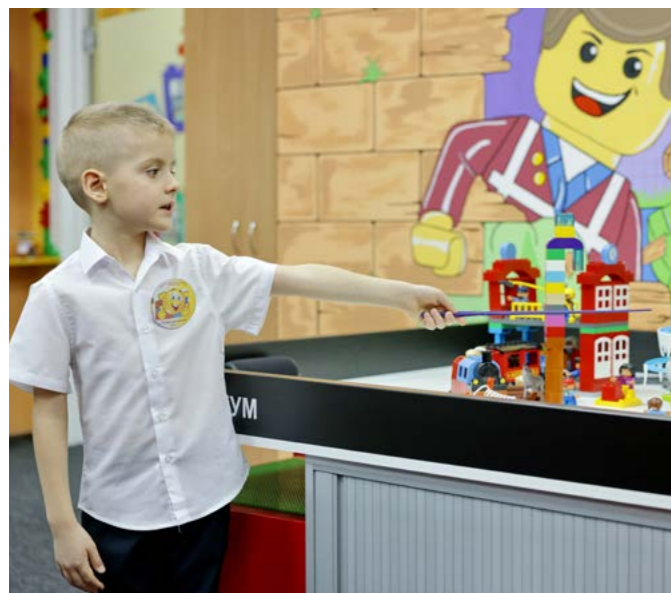
Команда «Электроник» спроектировала семейный развлекательный парк «Суляко»