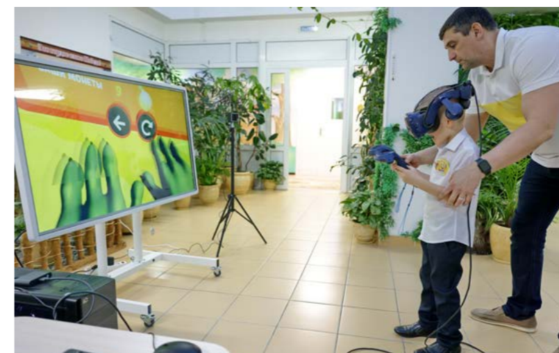
Параллельно с соревнованиями в зимнем саду проходили мастер-классы «Параллельные миры» и «Секретный лабиринт»