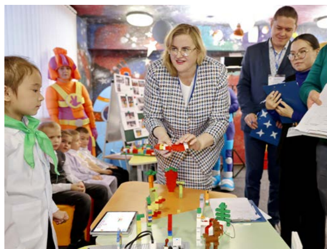
Воспитанники детского сада «Радуга» презентовали членам жюри свой проект «Полезная еда, всем она нужна»

Инновации. 8 декабря в Тазовском среди дошкольников прошли III районные соревнования по робототехнике «РОБОТУР»