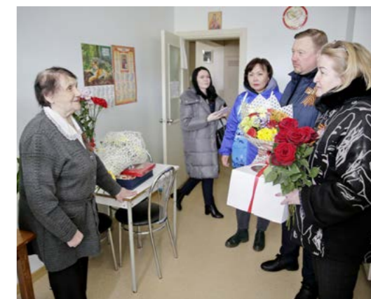
Члены партии «Единая Россия» поздравили ветерана с Днём Победы, 2022 год

Дедушка нам плёл лапти из липовой коры. Потом ходили учиться в соседнюю деревню - там «семилетка» была. Даст мама мешок картошки и трёхлитровый бидон молока на неделю: утром отваришь картошки, поешь, в обед тоже картошка и стакан молока, на ужин так же. Я так