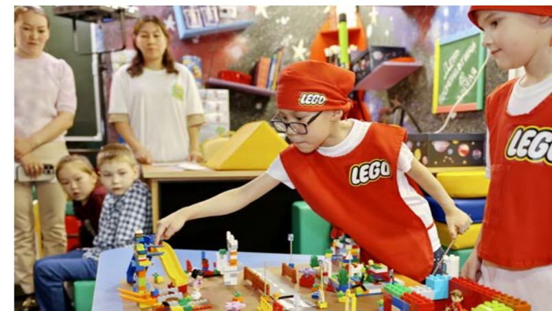
О Правилах дорожного движения с помощью конструктора LEGO рассказали воспитанники детского сада «Теремок»