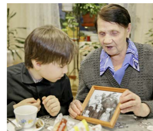
Встреча поколений в социальном доме центра «Забота», 2020 год