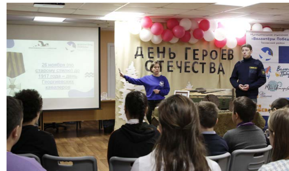
ЕВГЕНИЯ СОЛОВЬЁВА ФОТО АВТОРА

С какого года отмечается День Героев Отечества и когда было учреждено звание Героя Советского Союза? Об этом рассказали газ-салинским школьникам на уроках мужества