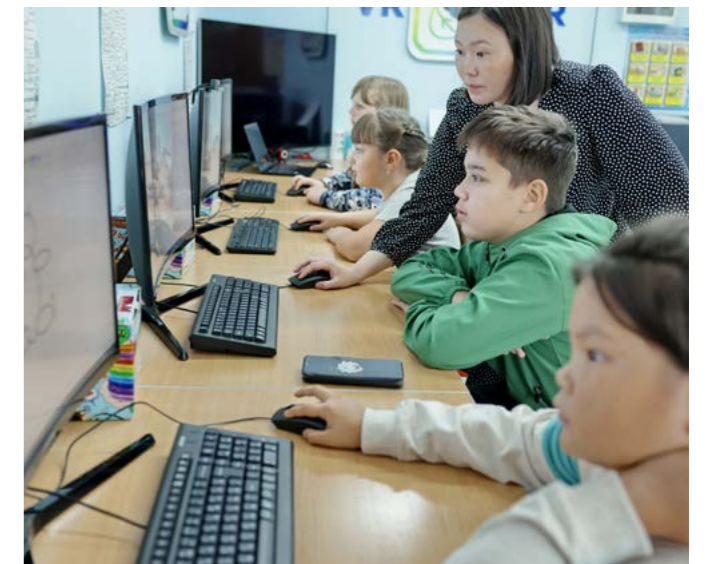
Мастер-класс «Рисуем на компьютере просто» помогает ребятам разобраться с различными цветовыми фигурами и развивать воображение