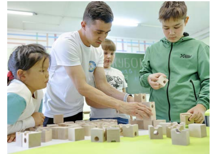
На базе Дома творчества открылось новое направление «Куборо»