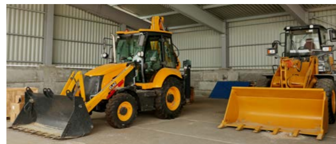
Рядом с площадкой накопления отходов стоят новенькие погрузчики, которые станут «руками» рабочих

Проектом предусмотрены плоскостные уклоны, все стоки проходят по специальным желобам и поступают на локальные очистные сооружения, где очищаются до состояния технической воды. Вокруг полигона - километровая санитарно-защитная зона, по периметру пробурены специальные контрольные скважины, в которых в рамках производственного контроля с определённой периодичностью будут проводиться замеры. Проект прошёл государственную экологическую экспертизу, за этот год, что мы оформляем документацию и получаем лицензию, нас неоднократно проверяли на соответствие всем экологическим нормам. Само