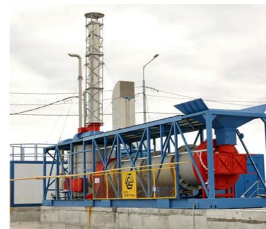
Инсинератор или попросту печь. В ней будут сжигать твёрдые коммунальные отходы и нефтешламы. Производительность этого агрегата - 2 тысячи тонн в год

Тазовский полигон ТБО - это современный комплекс со специализированным оборудованием на 90 процентов отечественного производства. Здесь будут принимать и обеззараживать отходы. Главный помощник человека - специализированное оборудование. Прежде всего, инсинератор - печь для сжигания отходов. Большую часть мусора будут сжигать именно в ней при темпе-