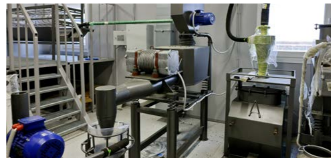
В этом помещении будут храниться и обезвреживаться ртутьсодержащие отходы, а точнее, люминесцентные лампы. За один раз установка способна переработать 2 500 штук