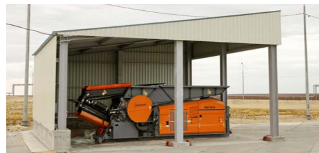
Шредер - один из главных агрегатов на полигоне. Этот аппарат передвижной и может переработать всё - от бумаги до бетона, а дальше - либо в печь, либо на карту захоронения

- Территорию сначала отсыпали мёрзлым грунтом, затем укладывали пеноплекс, который удерживает температуру, поверх него положили бентонитовые маты - антифильтрационный гидроизоляционный материал, который обеспечивает максимальный уровень экологической и промышленной безопасности. Маты свариваются между собой и не допускают проникания жидких фракций в почву.