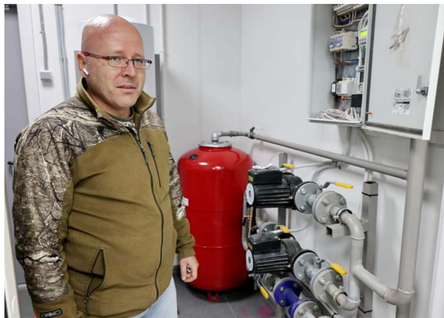
Представитель подрядчика показывает «сердце» новой ветклиники. Здесь размещены все приборы учёта, а также автоматика, отвечающая за бесперебойное энергоснабжение

АПК. В два раза больше площадь, новое оборудование и полностью автоматизированная система управления. В районном центре завершается строительство ветеринарной клиники