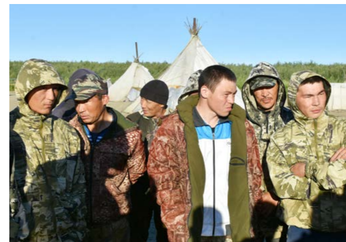
Тазовские рыбаки говорят, что при лове сетями попадает очень мало рыбы

- Правительство Ямало-Ненецкого автономного округа совместно с Всероссийским научно-исследовательским институтом рыбного хозяйства и океанографии ведут работы по мониторингу подъёма сиговых видов рыб в реку Таз. Это нужно для того, чтобы в дальнейшем определить существующие запасы данных видов, чтобы затем оперативно и своевременно регулировать режимы промысла на реке Таз. Подобная работа проводится на всех водоёмах ЯНАО, в том числе на Оби и её притоках. Эти мероприятия являются одними из ключевых в комплексной программе по восстановлению сиговых видов рыб по всему Западно-Сибирскому рыбохозяйственному бассейну, -