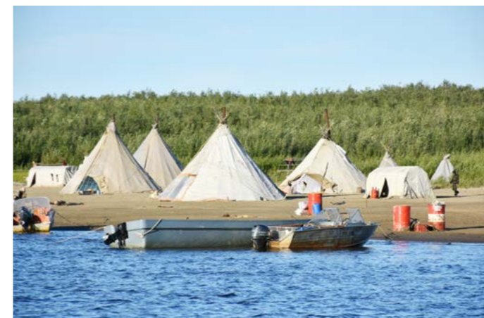
Сейчас на Нямгудочи и других рыболовецких песках затишье. Рыбаки фактически простаивают без работы