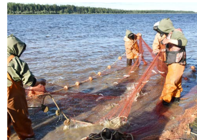
Запрет неводного лова в верховьях реки Таз введён с 10 по 31 августа