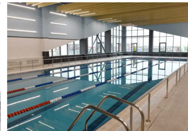
В Арктическом лицее дети смогут заниматься плаванием