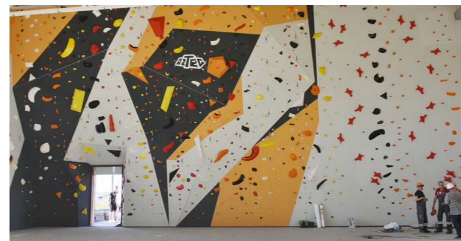
Высота скалодрома - более 11 метров. Здесь есть пять дорожек различного уровня сложности

рудован по последнему слову техники, здесь установят комфортные кресла. Его вместимость составит около 430 зрителей.