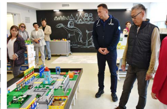
Детский сад «Созвездие» оборудован всем необходимым для развития малышей