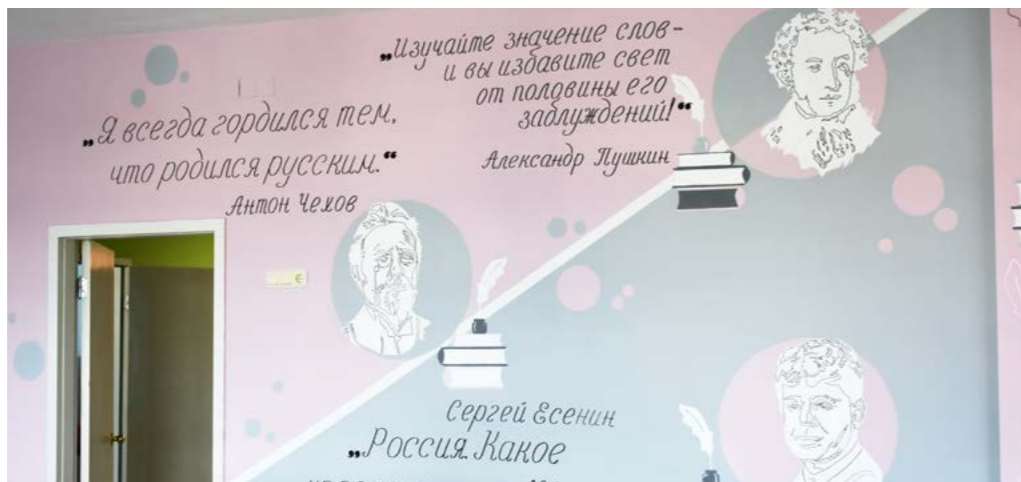
Кабинет русского языка и литературы