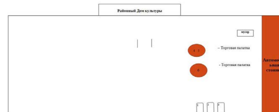
СХЕМА РАЗМЕЩЕНИЯ юридических лиц и индивидуальных предпринимателей, участвующих в ярмарке, посвященной празднованию Международного дня коренных народов мира в поселке Тазовский, на территории, прилегающей к Районному Дому культуры, 06 августа 2023 года

Приложение № 2 УТВЕРЖДЕНА постановлением Администрации Тазовского района от 01 августа 2023 года № 719-п