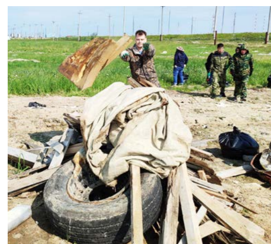
Спустя несколько минут после начала уборки в центре площадки уже вырастает куча мусора - в основном промышленного

Акция. На Ямале проходит Неделя экологии. В нашем районе она стартовала с масштабного субботника - 22 июля на уборку территории в Тазовском вышли 100 человек