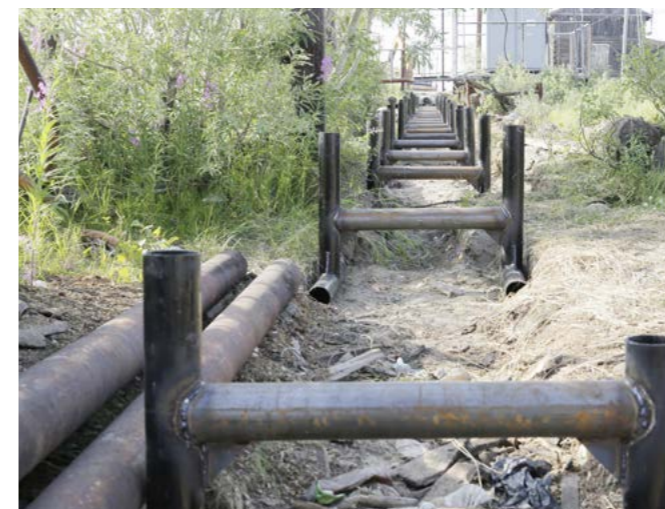
В ближайшее время начнётся монтаж новой теплосети

окружной субсидии. Кроме девяти объектов в Тазовском, по одному отремонтируют в Находке и Газ-Сале. Из окружного бюджета на это выделено 79 миллионов рублей, ещё семь добавляет муниципалитет.