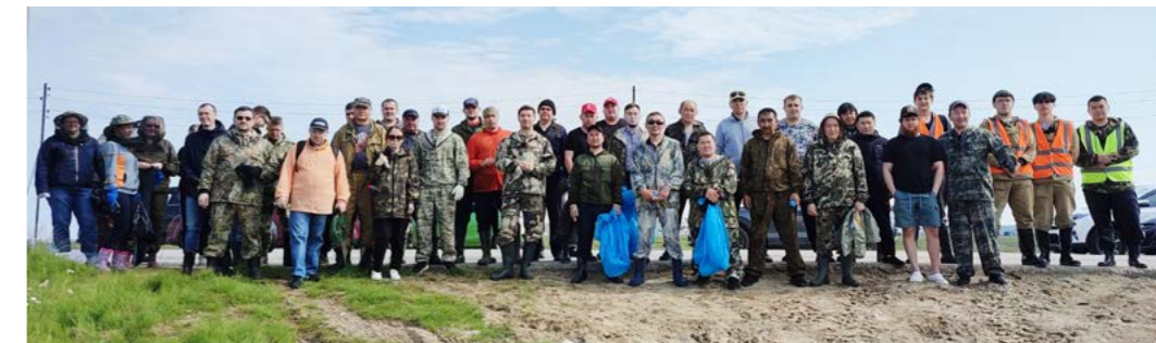
В субботнике приняли участие представители различных учреждений и организаций райцентра