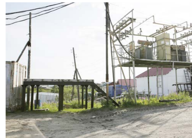
Основания для установки подстанций уже готовы

Эти работы проводятся в рамках подготовки к осенне-зимнему периоду с участием