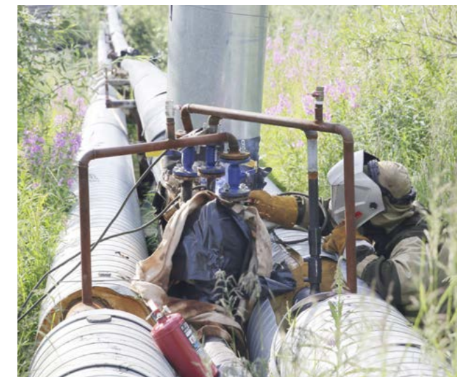
Коммунальщики переподключают потребителей к новой сети тепловодоснабжения от рыбозавода до спортшколы