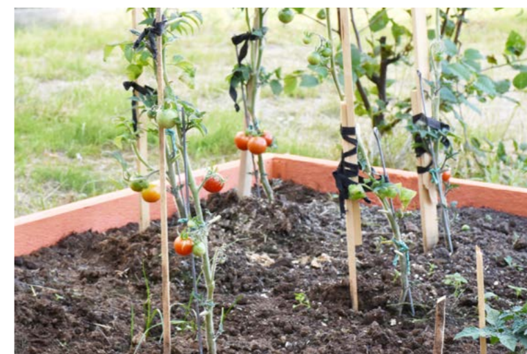
Первый урожай, который появился ребятам из летнего оздоровительного лагеря «МиР»