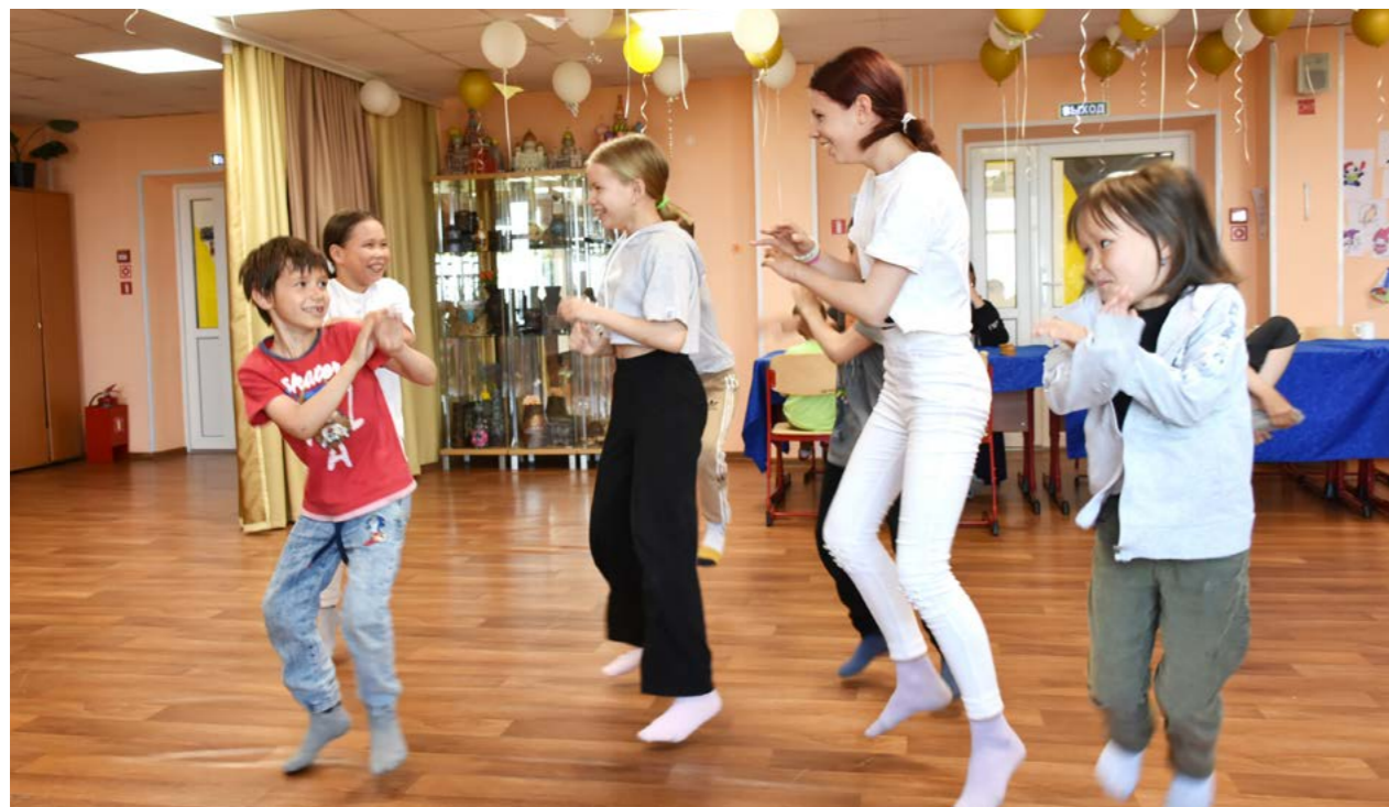
После закрытия смены ребята продолжили дружно и весело танцевать под любимые песни