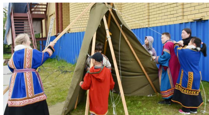
Юные тазовчане познакомились с ненецкой культурой и сами попытались установить чум