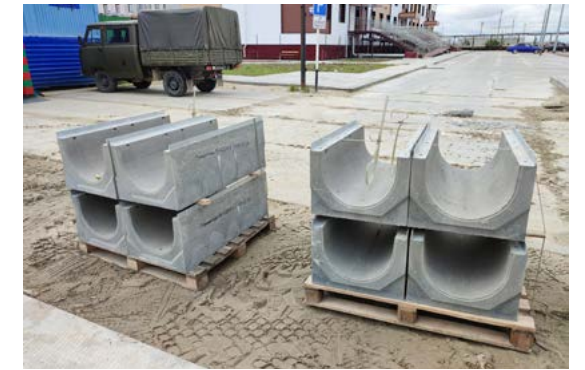
В микрорайоне Маргулова идёт монтаж водоотводной системы