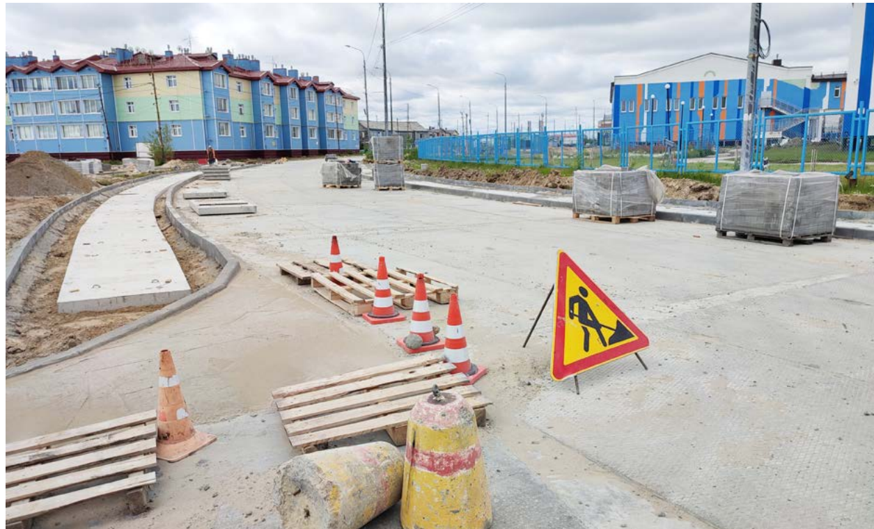
На улице Заполярной будет отремонтировано почти 600 метров дороги, ширина проезжей части увеличится с 6 до 8 метров