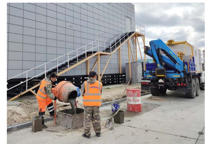
Самый протяжённый участок дороги, который отремонтируют этим летом, находится в мкр. Маргулова. Его длина составляет более одного километра

Сроки завершения капитальных ремонтов по всем трём объектам по контрактам - конец сентября. Но дорожники планируют открывать участки дорог по мере готовности. Первой станет доступна для проезда улица Северная. Это должно случиться в ближайшие недели.