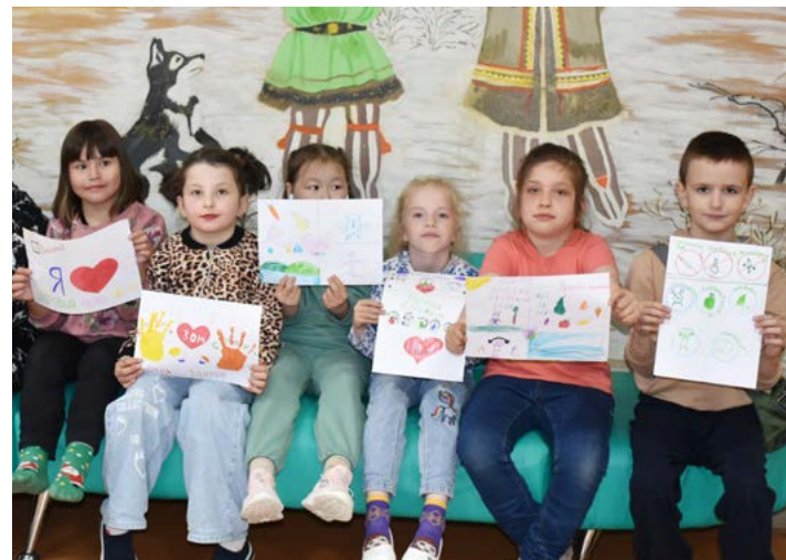
Творческое задание, с которым школьники отлично справились: каждый нарисовал рисунок на тему «Здоровый образ жизни»