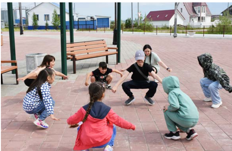
Утренняя танцевальная зарядка на свежем воздухе

Досуг. Чем заняться в районном центре детям, которые не уехали на летние каникулы из посёлка? В Тазовском прошло мероприятие «Дворовое лето», где юные тазовчане весело провели время