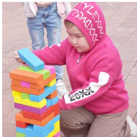
Юная тазовчанка играет в дженгу