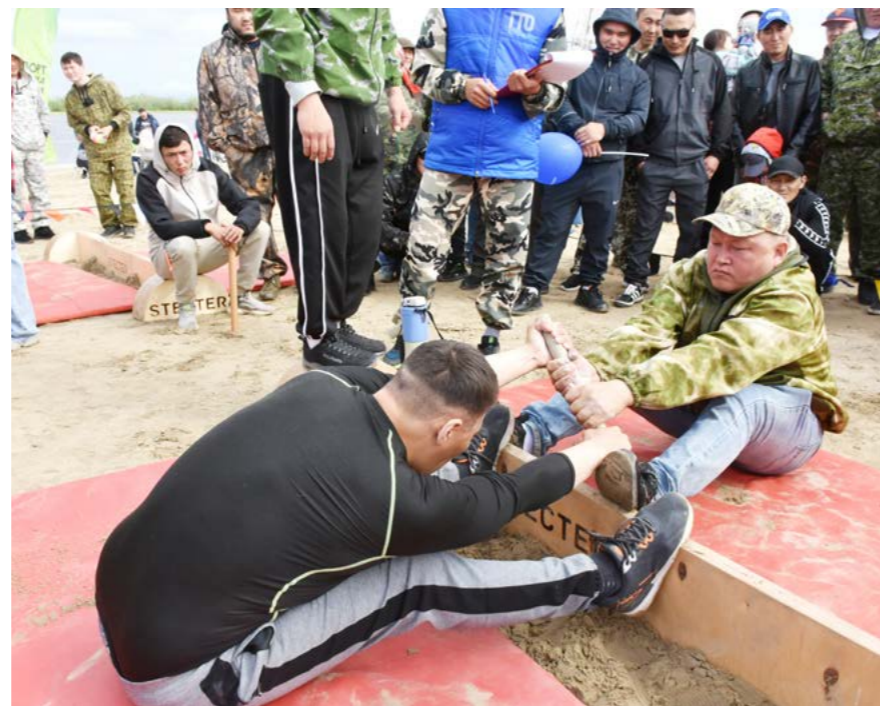
► БОЛЬШЕ ФОТОГРАФИЙ К ЭТОЙ ТЕМЕ В НАШИХ ГРУППАХ В СОЦСЕТЯХ