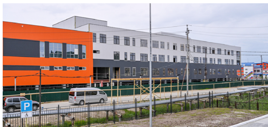
Готовность новой школы, которую в Тазовском возводит Северная строительная компания, составляет 50 процентов

Рабочий визит. 3 июля Губернатор Ямало-Ненецкого автономного округа Дмитрий Артюхов работал в Тазовском. Глава региона посетил социальные и строящиеся объекты