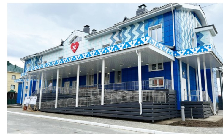
Педиатрия была открыта несколько месяцев назад. Маленькие пациенты и их мамы отмечают, что здесь созданы прекрасные условия для выздоровления. Дмитрий Артюхов пожелал удачи медперсоналу в работе