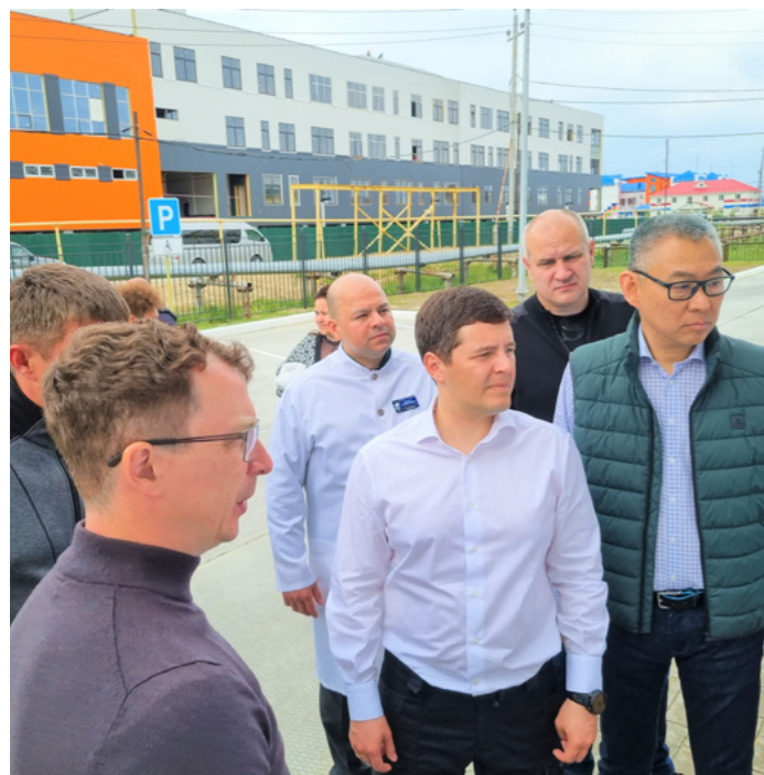
Губернатор Ямала и Глава Тазовского района обсуждают проекты строительства новых отделений ЦРБ и дизайн помещений школы на 800 мест