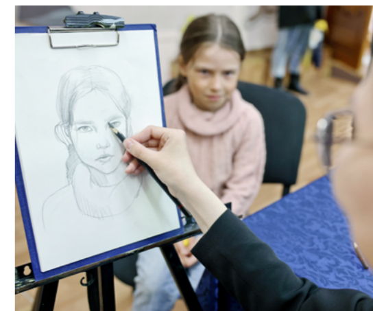
Портрет - подарок на память о Международном дне защиты детей 2023 года