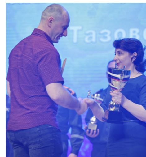
Капитану команды «Образование» вручают кубок за победу в XXIII Спартакиаде трудящихся Тазовского района

Одержав победу в сентябре прошлого года в самом первом виде - полиатлоне, сборная «Образование» так никому больше и не отдавала первое место в общем зачёте. Всего в Спартакиаде за «Образование» выступали около 60 человек - они также смогли завоевать «золото» в шахматах и шашках, настольном теннисе и дартсе. Достаточно сказать, что из 12 видов только в одном - в баскетболе - сборная «Образование» осталась за чертой призёров. Такое уверенное выступление в итоге позволило опередить занявшую второе место команду «Ветеран» на 9 баллов, «бронза» XXIII Спартакиады досталась команде «Огнеборец».