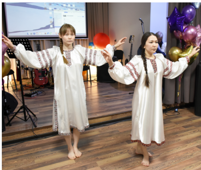
«Ночь музеев» в Тазовском открылась танцем «Дочь Земли», который исполнил коллектив «Нежность»

20 мая в Тазовском прошла «Ночь музеев» под общим названием «История и истории»