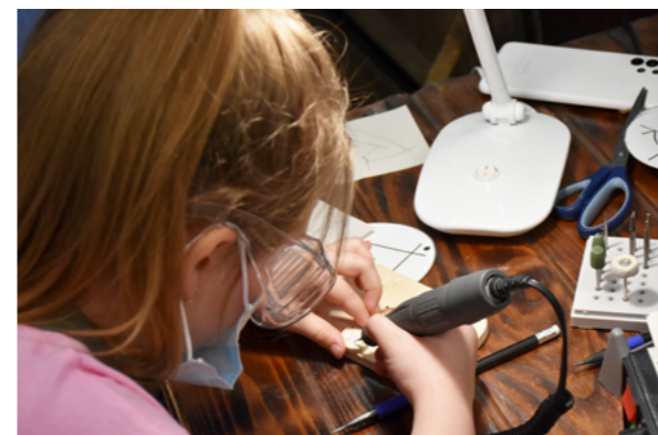
В этот вечер в музее тазовчане могли почувствовать себя мастером резьбы по кости, нарисовать красивую картину...