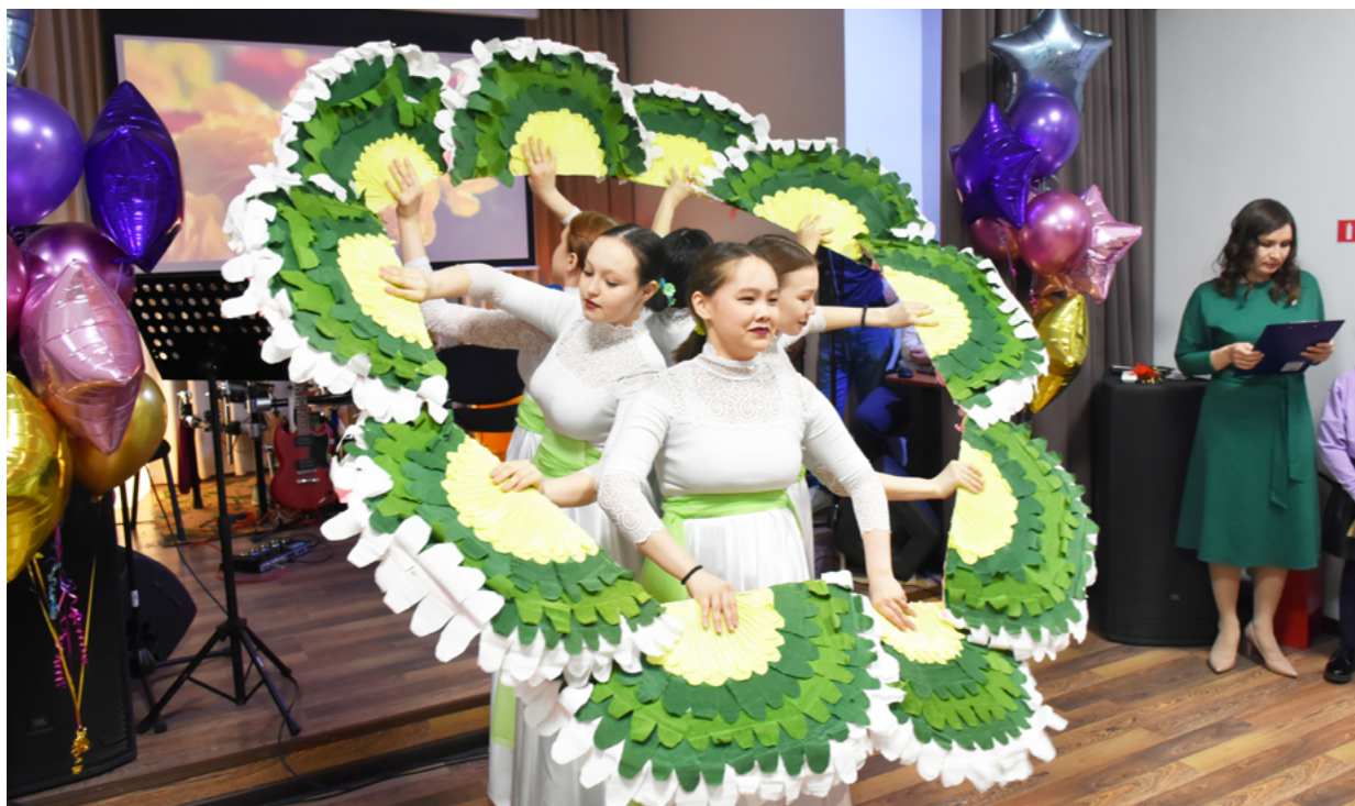
Танцевальный номер «Искусство веера» показали гостям мероприятия юные артистки из объединения «Я - тазовчанин»