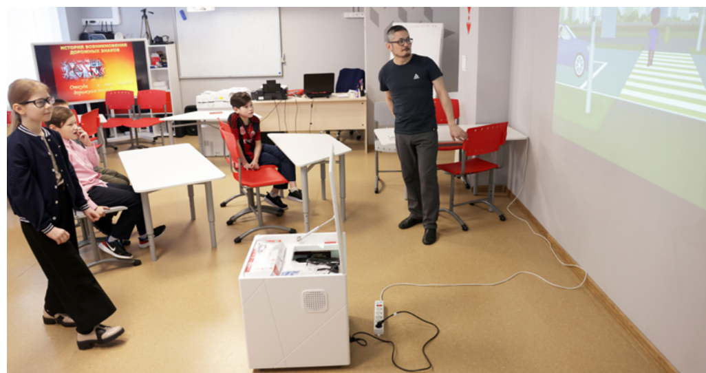
«Точка роста» в Антипаютинской школе-интернате пользуется у учеников большой популярностью. Здесь проходят занятия как для начальной школы, так и для старшеклассников

- Я с сентября занимаюсь резьбой по кости. Начинать с простого, с медальонов. С костью несложно работать, главное - хотеть. Постепенно переходил к более сложным изделиям. Первой такой фигуркой стал мамонтёнок, его подарил сестре. Сейчас вырезаю фигурку рыбака, поса-