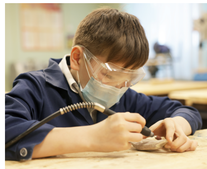
Оборудование позволяет школьникам осваивать разные навыки. Здесь научат косторезному ремеслу и резьбе по дереву

После реконструкции в школе появился тренажёрный зал. Укрепить здоровье и поддержать форму приходят не только ученики, но и педагоги