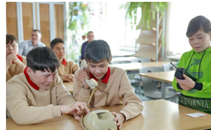
Гости фестиваля привезли радиотелефон и телефон с дисковым набором для наглядности технологического прогресса

Участники Фестиваля выбрали наиболее важные для себя направления и отправились получать знания. Так, например, старшеклассницам естественно-научного класса ТСШ интересно было послушать о лабораторных