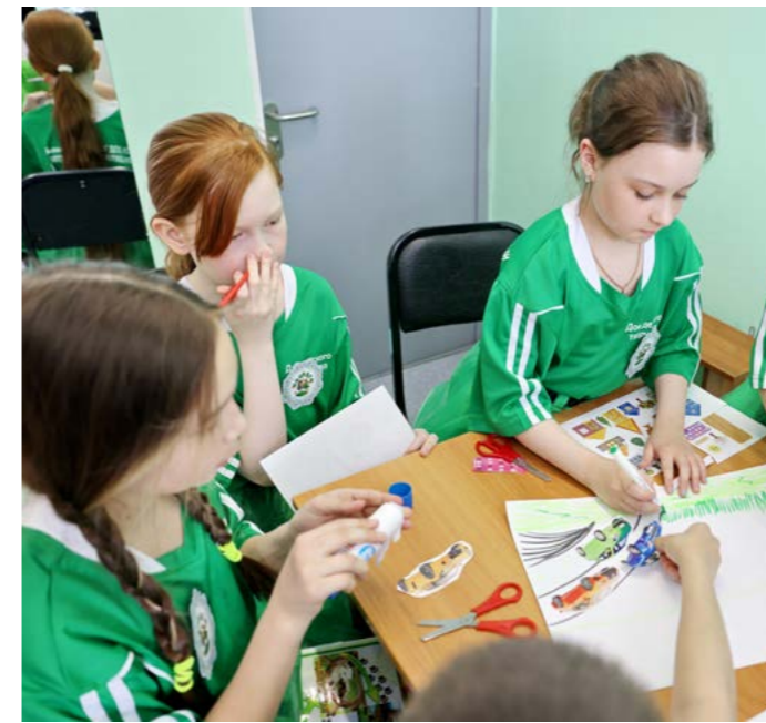
Каждая команда придумала свой экологический город или посёлок, а после - защитила проект

- Всего ребятам необходимо пройти шесть станций, где они будут отвечать на вопросы и выполнять практические задания. Квест-игра - это способ привлечь внимание детей к проблемам окружающей среды, научить беречь природу и объяснить, что от нас зависит, в