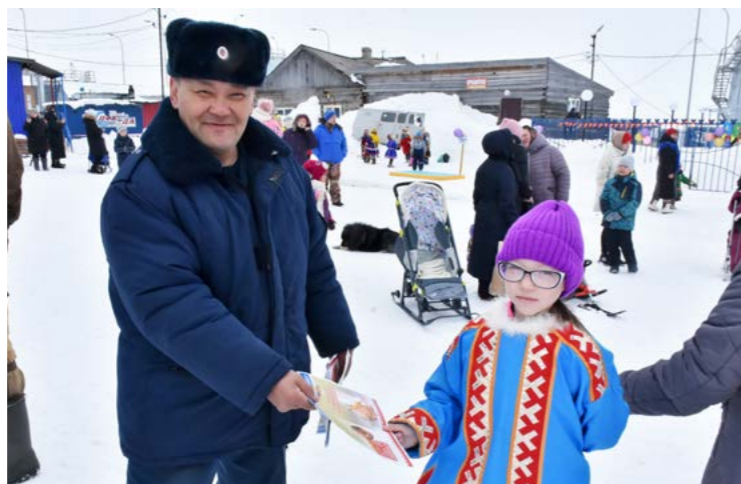
Профилактическая работа среди юных жителей села - одно из основных направлений деятельности пожарных Находки

За последние два года в Находке произошло всего два пожара. О том, как работают сотрудники пожарной части этого села, - в нашем материале