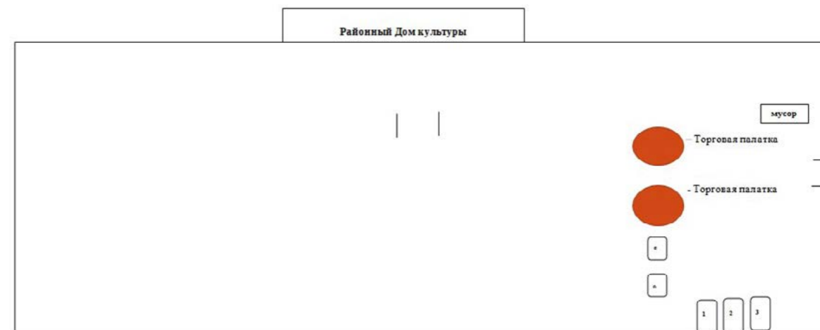
СХЕМА РАЗМЕЩЕНИЯ юридических лиц и индивидуальных предпринимателей, участвующих в ярмарке, посвящённой проведению Праздника Весны и Труда и Проводам зимы, в посёлке Тазовский на территории, прилегающей к Районному Дому культуры, 1 мая 2023 года

В электронной форме доступны услуги в сфере: