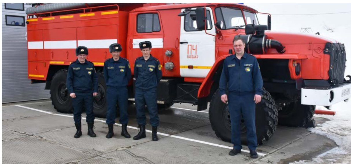
Штатная численность ПЧ по охране села Находки составляет 16 человек. Ежедневно в караул заступают трое пожарных