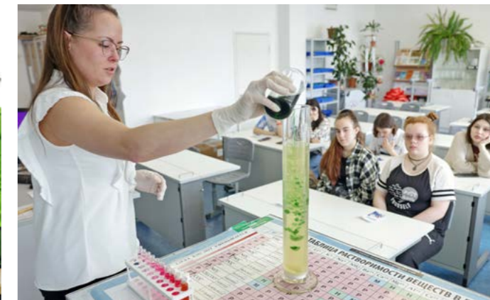
Специалист «НОВАТЭК-ТАРКОСАЛЕНЕФТЕГАЗ» показала ребятам, как делать лава-лампу с помощью масла и реактивов

исследованиях, которые проводят в районной больнице.