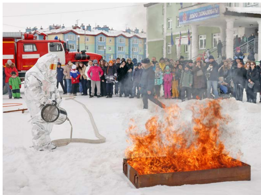
Бойцы пожарной части продемонстрировали технику и оборудование, с помощью которых они устраняют возгорания

Образование. Какие профессии актуальны и востребованы в нашем муниципалитете? На эти вопросы 22 апреля в Тазовской средней школе учащимся района ответили специалисты разных сфер на Фестивале профориентации