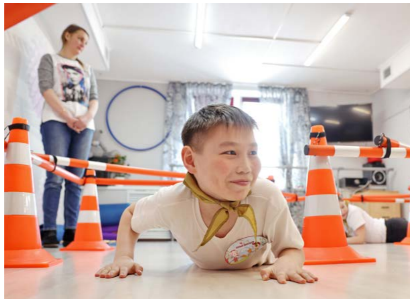
На станции «Туристическая» ребят научили завязывать разные узлы, рассказали, какие виды костров существуют, а также предложили попробовать сложить один из них. В ходе испытания детям требовалось проползти через препятствия