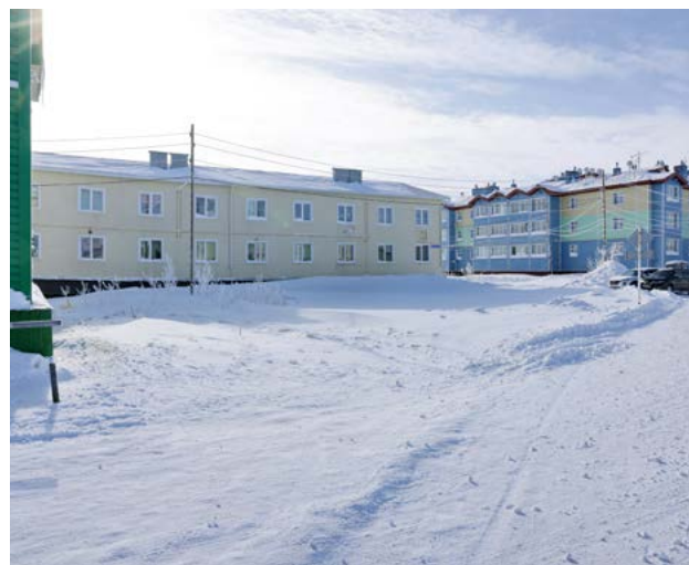
Небольшой пустыющий треугольник около дома Заполярная, 16, к концу августа преобразится в уютный школьный сквер