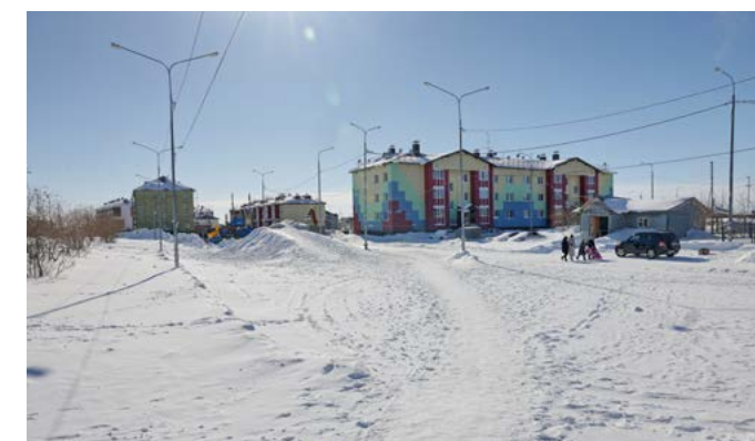
Обустройство общественной территории около дома Геофизиков, 18, продолжается с 2019 года. Этим летом в планах расширить детскую площадку и обустроить скейт-парк