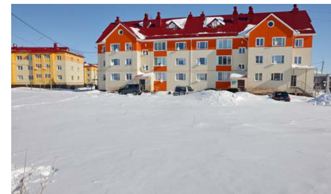
Болото перед домом Калинина, 11а, останется лишь на фото и в воспоминаниях жителей. На его месте летом обустраивают просторную детскую площадку в русском стиле

Также в планах на короткое северное лето капитальный ремонт трёх участков дорог в райцентре, обустройство парковок, установка светофоров, тёплых остановок, камер видеонаблюдения и озеленение.