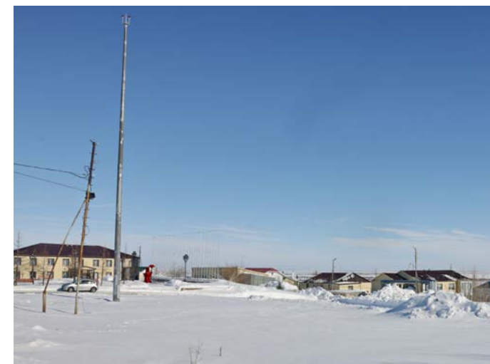
Вокруг флагштока летом будет кипеть работа. Здесь обустраивают площадь Памяти с обелиском, декоративным панно и красной звездой на входе

- Центральными элементами площади Памяти станут патриотические композиции: декоративное панно «Ордена Победы», обелиск «Слава русскому оружию» и входная группа в форме красной звезды и георгиевской ленты. Также в планах перенести сюда скульптурную композицию «Журавли», которая установлена возле