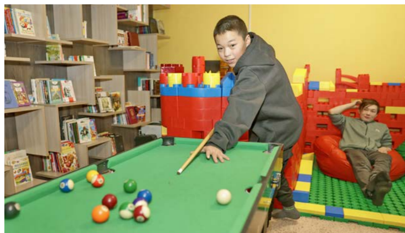
Модельная библиотека в Антипаюте открылась в начале 2020 года. Сегодня - это место притяжения для жителей села

Общие фонды библиотечной сети Тазовского района составляют порядка 65 тысяч экземпляров