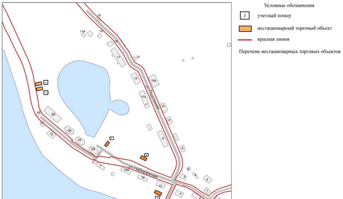
СХЕМА размещения нестационарных торговых объектов на территории села Находка

Приложение № 17 УТВЕРЖДЕНА постановлением Администрации Тазовского района от 01 сентября 2021 года № 805-п (в редакции постановления Администрации Тазовского района от 13 марта 2023 года № 197-п)