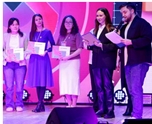
Победителям конкурса проектов, проходившего в рамках сессии «Поддержка молодёжных инициатив», были вручены денежные призы для реализации своих идей