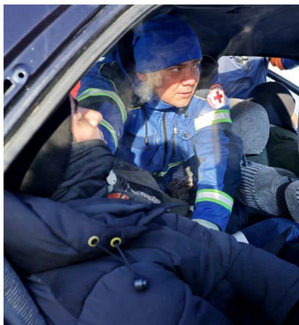
Медики осматривают водителя и пассажиров