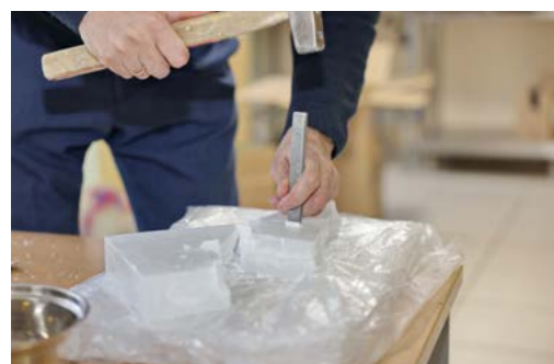
20 кг пара- фина сна- чала надо расколоть, а потом рас- топить и за- лить в банки с картоном

Помощь. И лампочка, и плитка, и маленькая печка: тазовские школьники начали изготавливать блиндажные свечи