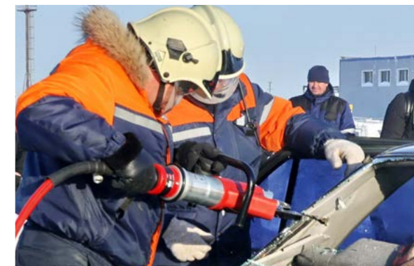
После того, как с помощью гидравлических ножниц