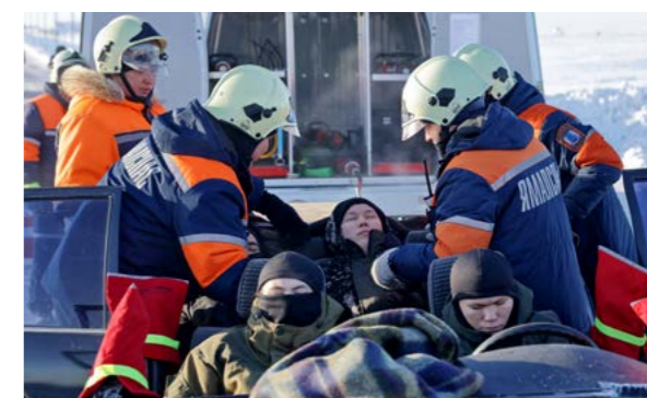
...они вытаскивают из машины находящихся там людей