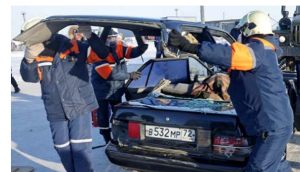
...спасатели отделяют крышу автомобиля,