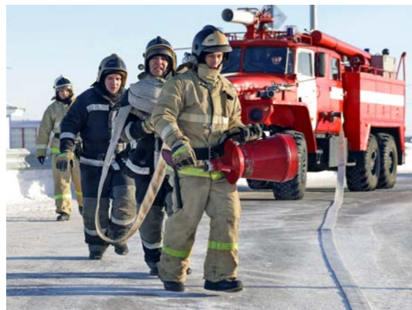
К месту происшествия прибывают пожарные, чтобы ликвидировать возможное возгорание