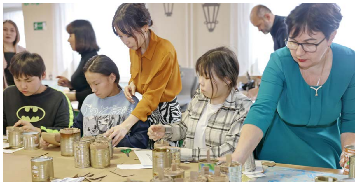
В столовой спального корпуса ТШИ ребята вместе с воспитате- лями сделали несколько десятков окоп- ных свечей

Помощь. И лампочка, и плитка, и маленькая печка: тазовские школьники начали изготавливать блиндажные свечи