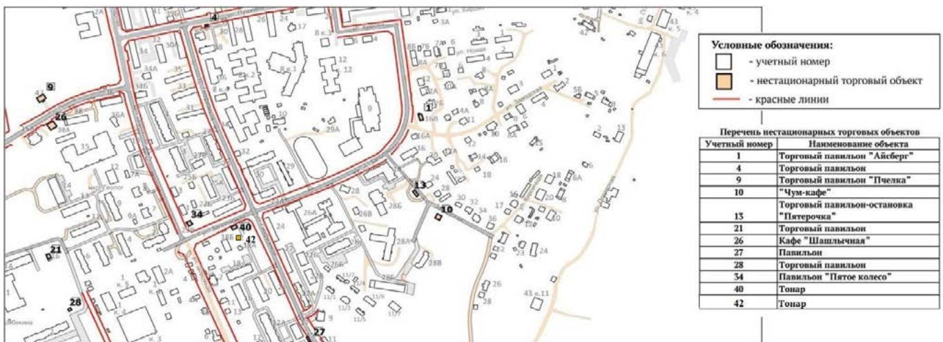
СХЕМА размещения нестационарных торговых объектов на территории поселка Тазовский

Приложение № 5 УТВЕРЖДЕНО постановлением Администрации Тазовского района от 01 сентября 2021 года № 805-п (в редакции постановления Администрации Тазовского района от 17 февраля 2023 года № 138-п)