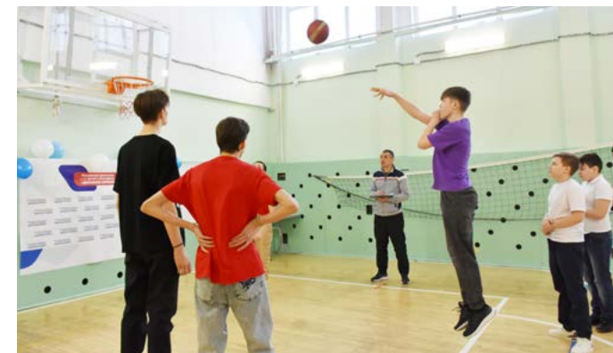
На станции «Спорт. ЗОЖ» школьники бросали мяч в кольцо, пробовали себя в дартсе и силовых упражнениях