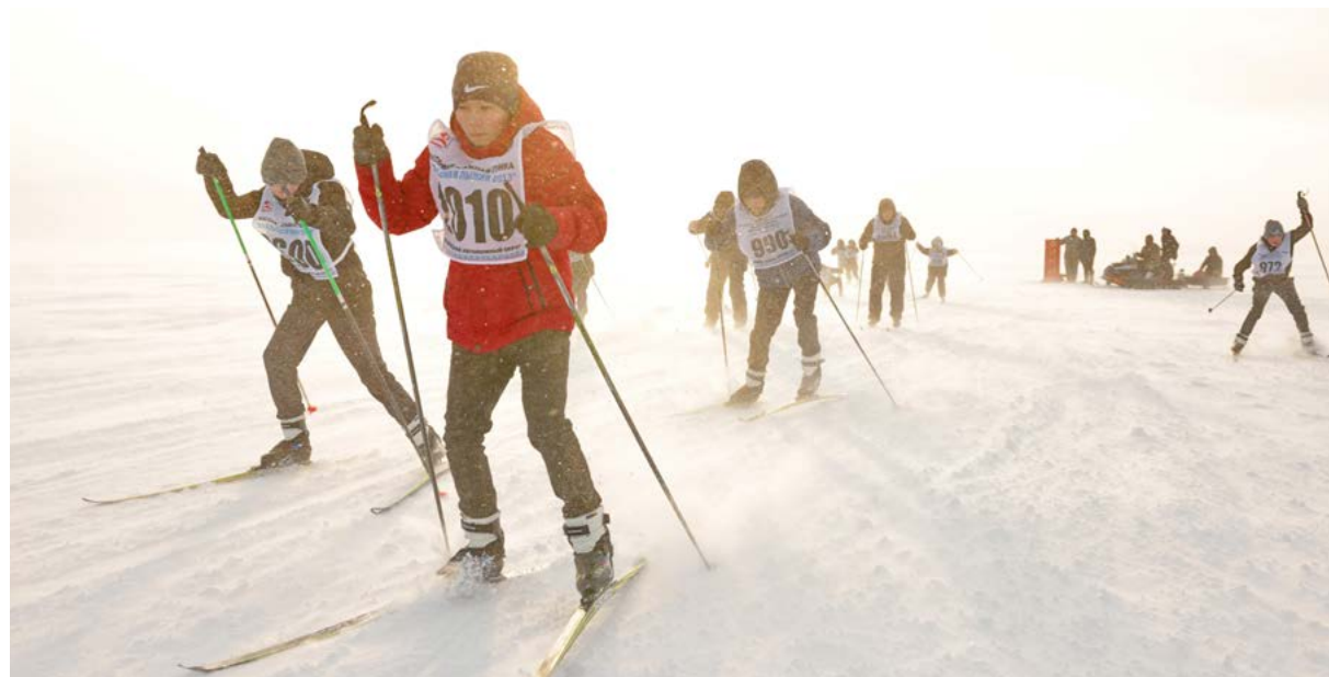
В лыжных гонках приняли участие 16 спортсменов - каждый проходил дистанцию, которая требуется для получения знака отличия: 1 000, 3 000 и 5 000 метров. Лучших наградили дипломами

ГТО. На выходных в райцентре прошло мероприятие «Троеборье ГТО», приуроченное ко Дню защитника Отечества. Тазовчане смогли проверить свои силы в стрельбе, метании спортивного снаряда и лыжных гонках