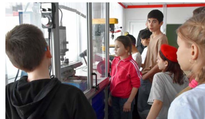
Ребята с интересом наблюдали, как фрезерный 3D-станок умеет вырезать логотип РДДМ на деревянной основе

- На каждой площадке ребята предлагают свои инициативы, как сделать их школьную жизнь интересной и весёлой. Поначалу им сложно было, но потом все загорелись и стали активнее. Из предложенных выберем самые интересные идеи и реализуем их вместе с нашим школьным самоуправлением.