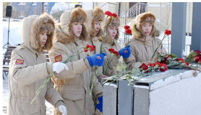
АНДРЕЙ АРКАДЬЕВ ФОТО АВТОРА

В полдень возле мемориала воинам-тазовчанам, погибшим в годы Великой Отечественной войны, собрались ученики кадетских классов, юнайрменцы, официальные лица, представители трудовых коллективов и, конечно, те, кто в разные годы служил Родине за пределами страны - воины-интернационалисты. Они смогли вернуться к мирной жизни, но тысячи солдат погибли в различных войнах и локальных конфликтах. В память о них в руках у собравшихся алели красные розы и гвоздики.