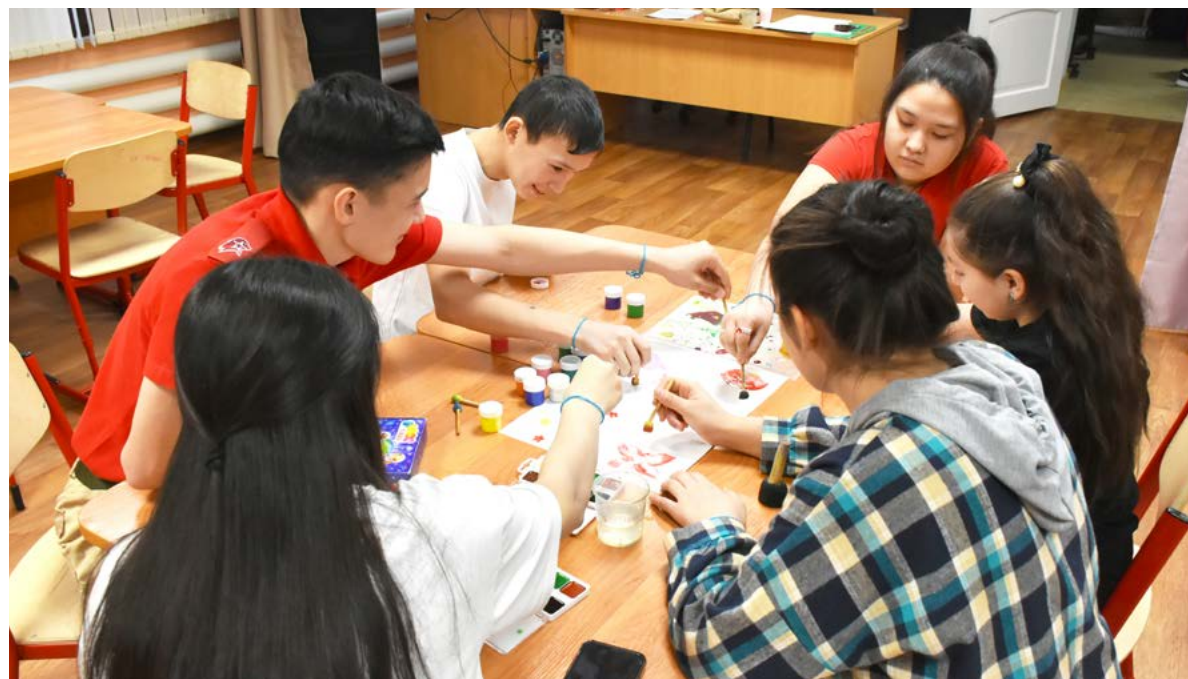
На площадке «Культура и искусство» учащиеся предложили пофантазировать и нарисовать эмблему «Движения первых», используя краски и нестандартные инструменты для рисования