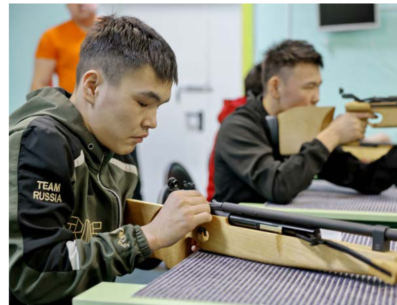
Всего участникам при сдаче нормативов комплекса ГТО разрешено выполнить 8 выстрелов: 3 пристрелочных и 5 зачётных

Напомним, что в 2022 году команда Тазовского района в общем зачёте заняла 4 место среди всех муниципалитетов автономного округа. Наши экстремалы смогли завоевать «серебро» на этапе в Ноябрьске «Северный характер. Холод» и стали третьими на заключительном этапе в Салехарде.