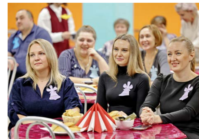
Забавные конкурсы, интересные истории из школьной жизни и шутки никого не оставили равнодушными. Выпускники смеялись так заразительно, словно им снова 17 лет