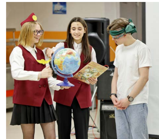
С завязанными глазами по звуку определить, что за предмет перед тобой - под силу не многим. Выпускники 2021 года с этим заданием справились

На борту условного лайнера выпускников ждал горячий чай и тёплая встреча с конкурсами, лотереями, играми и вопросами о школьных годах. И тут выясняется, что всё-то они прекрасно помнят: как звали первую учительницу, кто из педагогов заразительнее всех смеялся. А ещё с закрытыми глазами по звуку могут определить, как шуршит тетрадь, как стучит по столу указка, как пахнет мел. В этот вечер они снова школьники, немного повзрослевшие, но всё такие же весёлые и жизнерадостные, способные, кажется, покоришь весь мир.