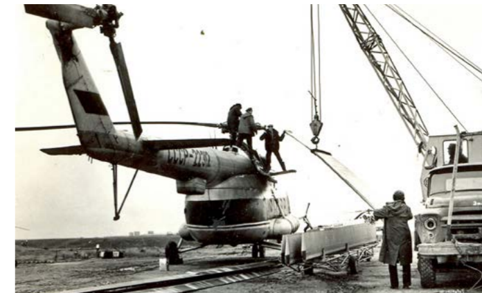
Пока не был построен ремонтный ДОК, технику в любую погоду приходилось ремонтировать под открытым небом

Книгу рекордов Гиннеса как единственная в мире модель, выпускаемая более 60 лет.