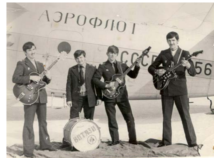
В 1975 году самодеятельная группа «Витязи», куда входили тазовские авиаторы, в честь 30-летия Победы совершила агитполёт по Тюменской области