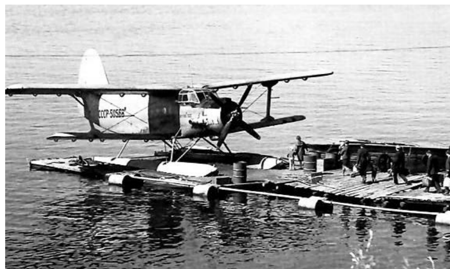
1975 год. Ан-2 гидро-вариант. Первые такие самолёты Тазовский аэропорт получил в 1968 году

Тот ледокол прошёл только до «Пуровских» вех, а в январе 1943 года, когда лёд окреп,