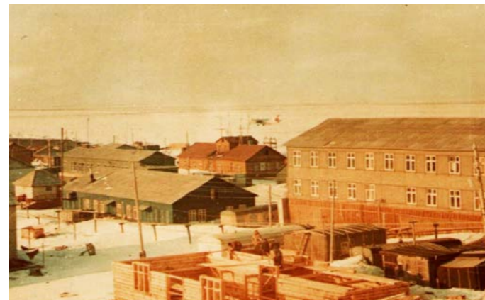
Год 1986. В микрорайоне Аэропорт районного центра строят магазин «Полёт»

В 1955 году в Салехарде и Тазовском успешно прошли испытания гидросамолёта Ан-2В. Этот лёгкий биплан заслуженно стал легендой советской авиационной промышленности и уже в наши дни вошёл в