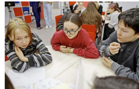
Ребята из Тазовской школы-интерната решили раз в неделю готовиться к следующим играм на базе своей школы

Например, в первом туре школьникам предстояло ответить, как сегодня называется Обдорский острог, кото-