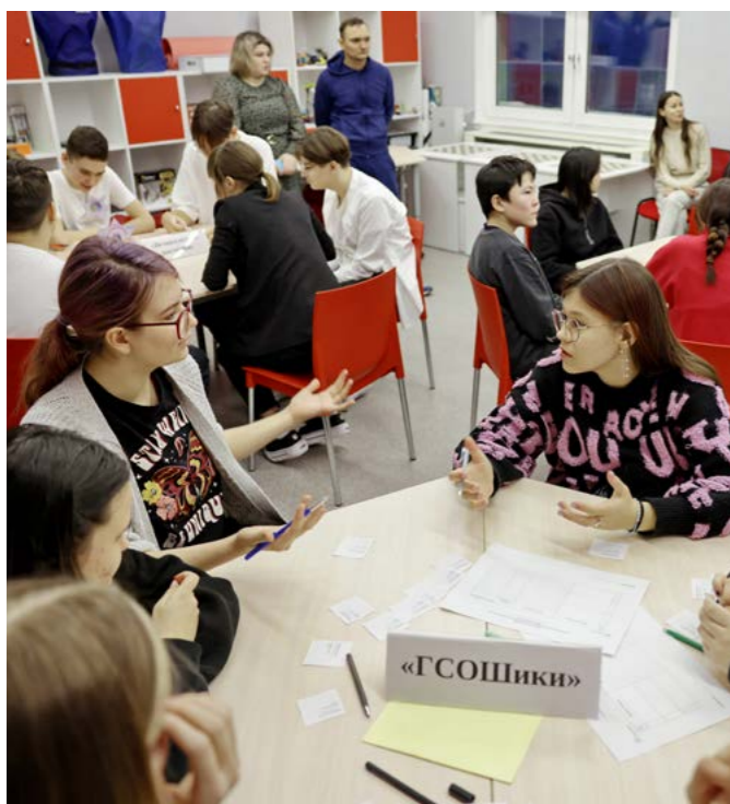
Команда «ГСОШики» стала второй по сумме набранных очков

Образование. 21 января в райцентре впервые состоялся муниципальный этап Ямальских интеллектуальных игр, в котором приняли участие школьники из Тазовского и Газ-Сале. Учащиеся гыданской и антипаютинской школ присоединились к мероприятию заочно