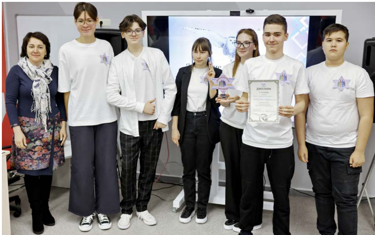
Победителями интеллектуальной игры стали ученики Тазовской средней школы. Они в феврале отправятся на региональный этап в Салехард