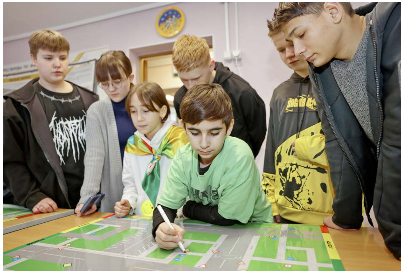
Суть одного из этапов состояла в том, чтобы начертить безопасный путь от дома до школы на велосипеде. По словам жюри, все ребята хорошо знают основы ПДД

БОЛЬШЕ ФОТОГРАФИЙ К ЭТОЙ ТЕМЕ В НАШИХ ГРУППАХ В СОЦСЕТЯХ