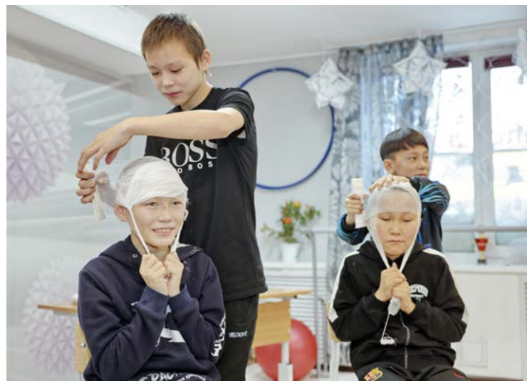
Участникам квеста предстояло пройти пять этапов, лучших определяли по количеству правильно выполненных заданий