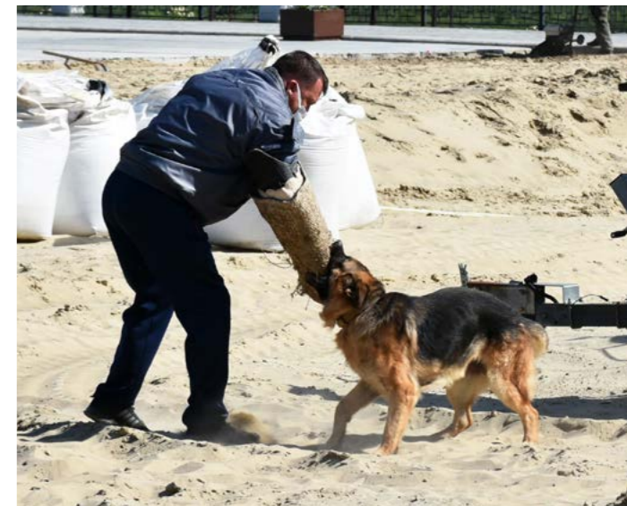
Школьники посмотрели, как тренируют служебную собаку