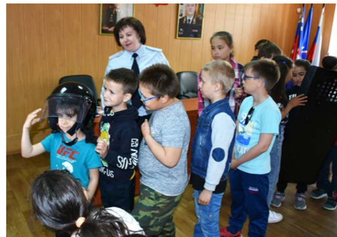
На примерку средств защиты выстроилась очередь