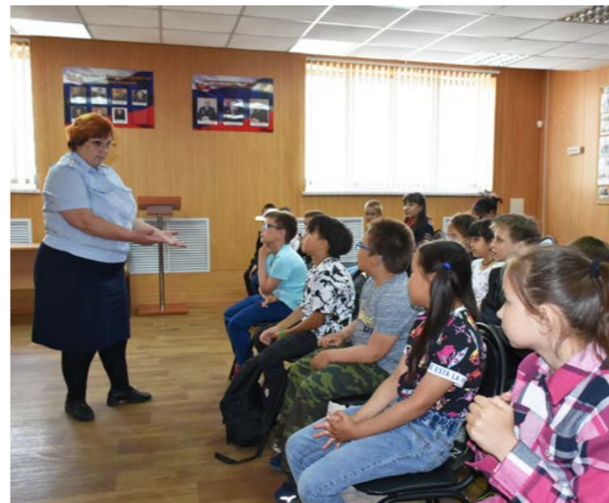
Инспектор группы ПДН поговорила с детьми о безопасности

Далее ребят ожидало ещё одно увлекательное знакомство: на этот раз со средствами защиты, которыми используют сотрудники полиции во время несения службы. Шлем, щит, бронжилет, автомат Калашникова и пистолет Макарова - дети могли всё потрогать и примерить.