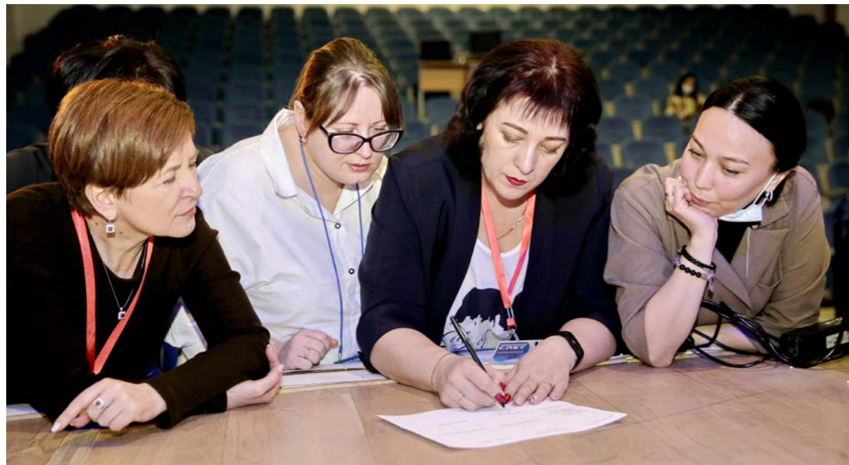
В рамках игр-активностей на сплочение участники Слёта определили, какими полезными навыками они обладают