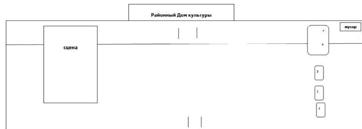
СХЕМА размещения юридических лиц и индивидуальных предпринимателей, участвующих в ярмарке, посвященной празднику «Гуляй, северная Масленица!», в п. Тазовский на территории, прилегающей к районному Дому культуры, 06 марта 2022 года

Приложение № 2 УТВЕРЖДЕНА постановлением Администрации Тазовского района от 02 марта 2022 года № 168-п