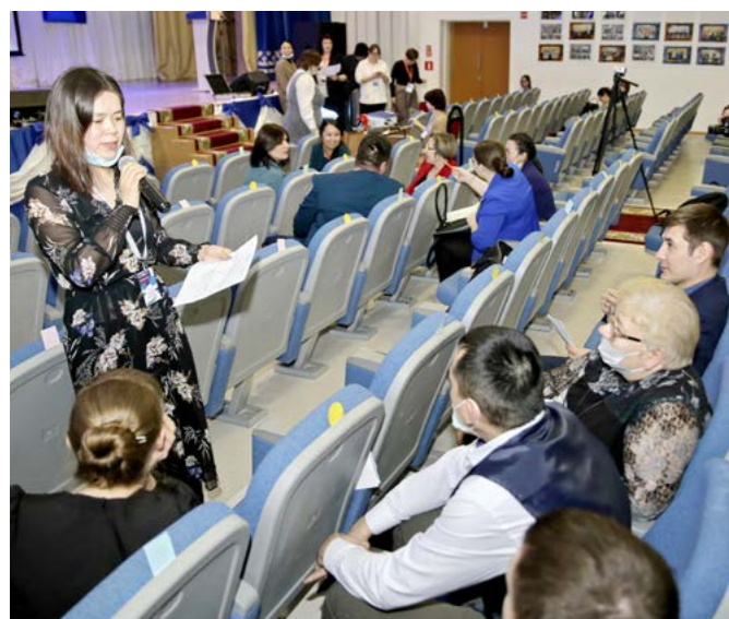
В группах поделились идеями на темы патриотического и гражданского воспитания, личностного развития, социального партнёрства

Практика. 2 марта в районном центре впервые прошёл муниципальный Слёт классных руководителей, в котором приняли участие педагоги тазовских средней школы, школы-интерната, а также Газ-Салинской средней школы