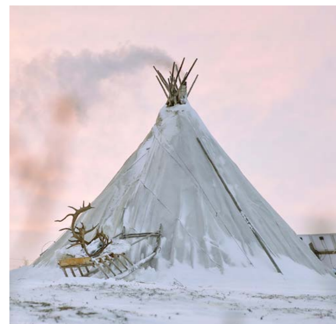
Гостевой чум «Тату» принимает гостей 2-3 раза в неделю

Гостеприимство. Перспективы развития туризма в муниципалитете обсудили на практическом семинаре, который прошёл в гостевом чуме «Тату» в минувшее воскресенье