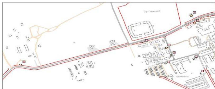
СХЕМА размещения нестационарных торговых объектов на территории поселка Тазовский

Приложение № 8 УТВЕРЖДЕНА постановлением Администрации Тазовского района от 01 сентября 2021 года № 805-п(в редакции постановления Администрации Тазовского района от 15 ноября 2021 года № 1008-п)