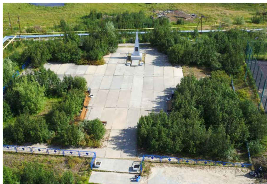
Такой площадь авиаторов была ещё этим летом

Установленный более 20 лет назад, в декабре 2000 года, первый памятник погибшим лётчикам мог так и остаться небольшой стелой, постепенно зарастающей кустарником, если бы не инициативные тазовчане