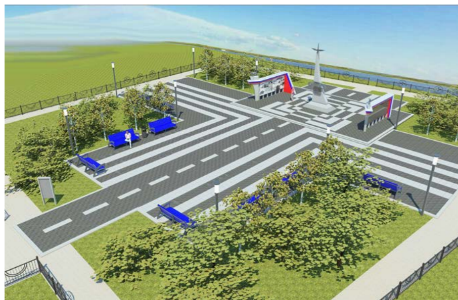
Такой её видят художники ООО «Постамент», а в будущем году увидят и тазовчане