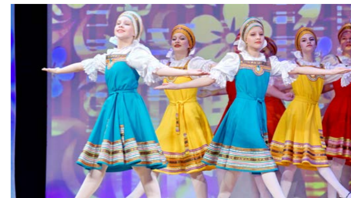
В подарок учителям - танцевальный номер «Девичья пляска»