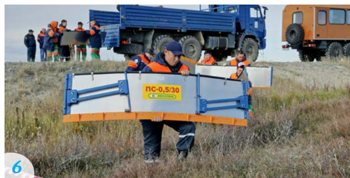
6 Затем личный состав приступает к установке подпорной стенки для недопущения дальнейшего разлива нефтепродуктов