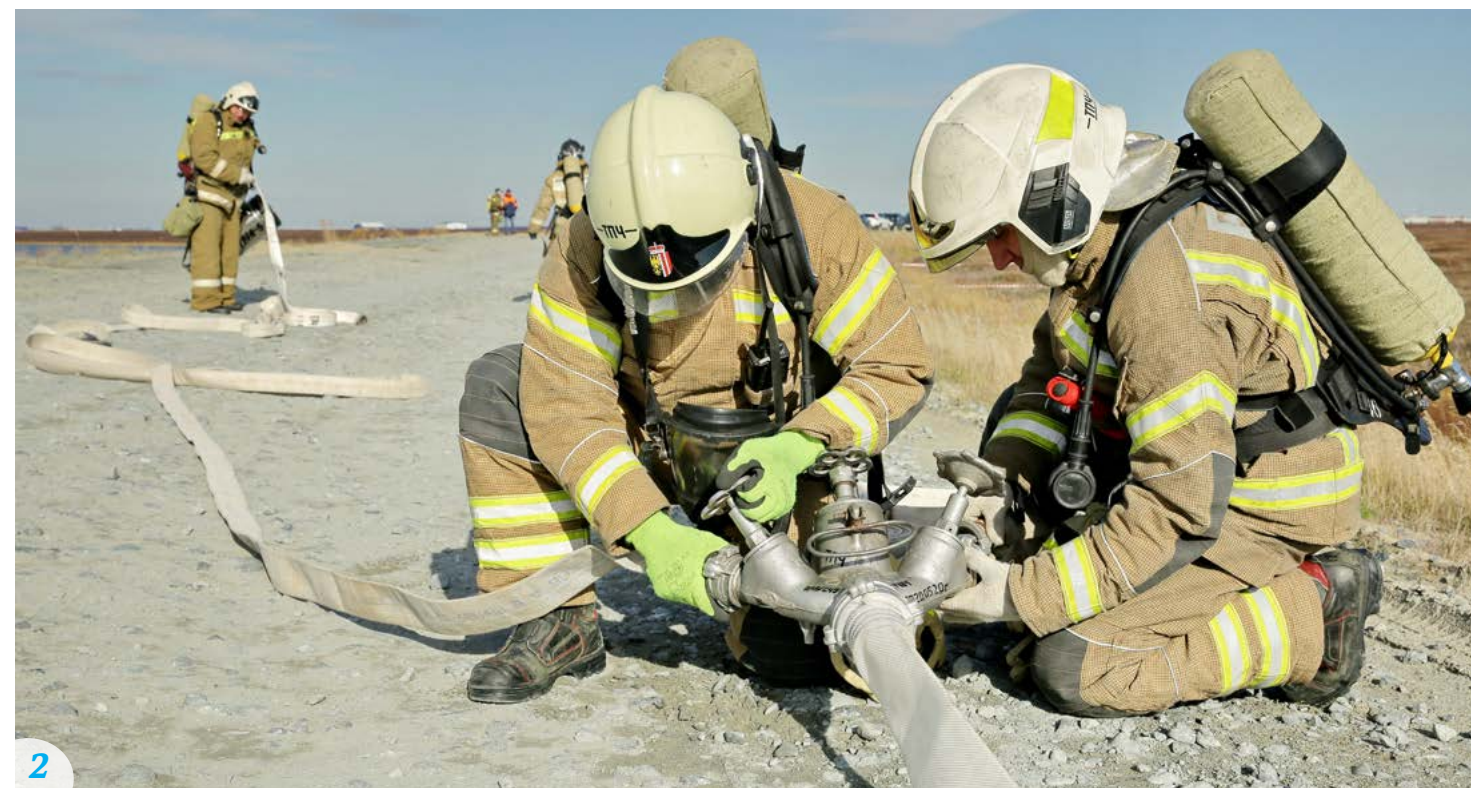
2 В случае реального разлива нефтепродуктов пожарные используют пенообразователь для предотвращения возгорания