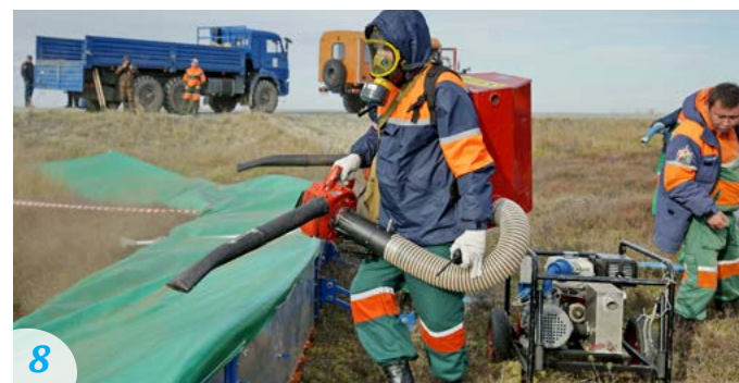
8 Подобные тренировки личный состав Тазовского филиала поисково-спасательного отряда «Ямалспас» проходит регулярно