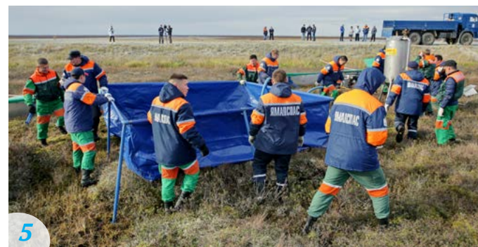
5 Следующий этап - сбор нефтепродуктов во временный резервуар