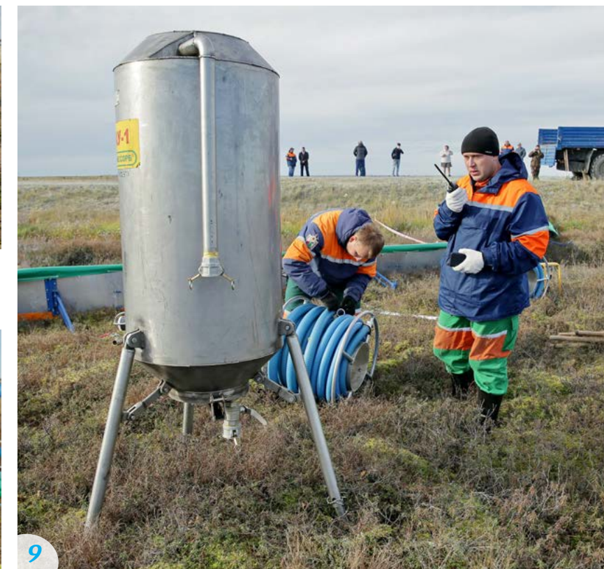
9 На ликвидацию ЧС потребовалось 45 минут. Общая оценка для всех задействованных служб - «хорошо»