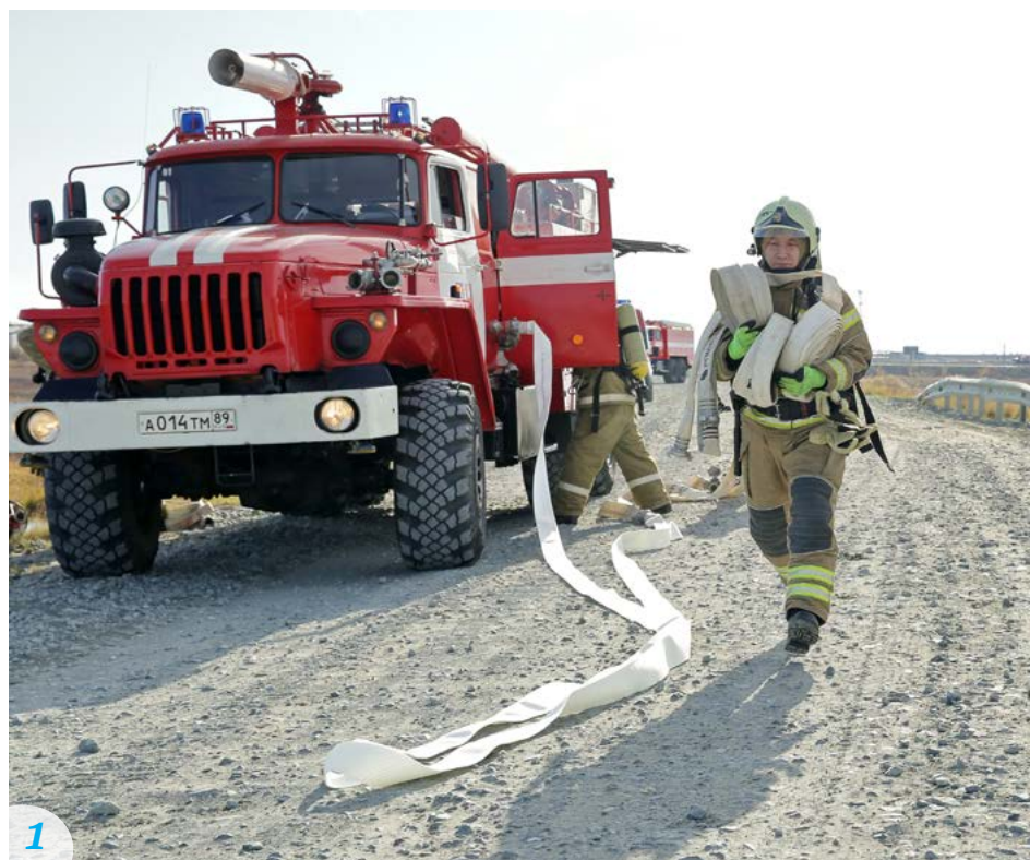
1 Первыми на место учений прибывают пожарные ОПС ЯНАО по Тазовскому району

О том, как прошла ликвидация разлива нефтепродуктов, - в нашем фоторепортаже.