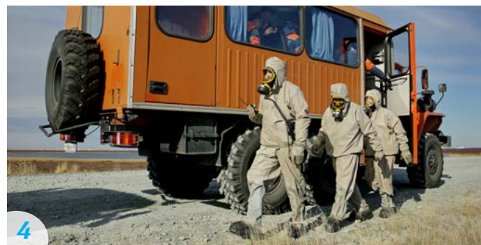
4 На объект выходят газоспасатели. Они исследуют территорию на предмет загазованности воздуха