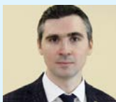
АЛБЫЧЕВ Кирилл Сергеевич, директор Департамента информационных технологий и связи ЯНАО