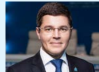
АРТЮХОВ Дмитрий Андреевич, Губернатор ЯНАО