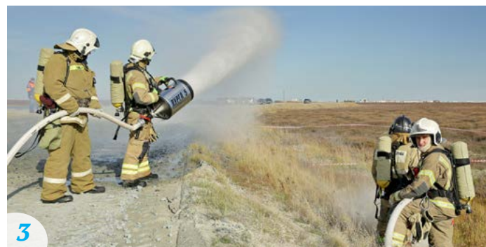
3 Во время учений, чтобы не загрязнять тундру, огнеборцы заливают участок, где «произошла ЧС», обычной водой