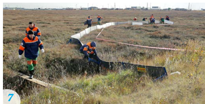
7 По легенде, общая площадь разлива нефтепродуктов составляет 500 квадратных метров