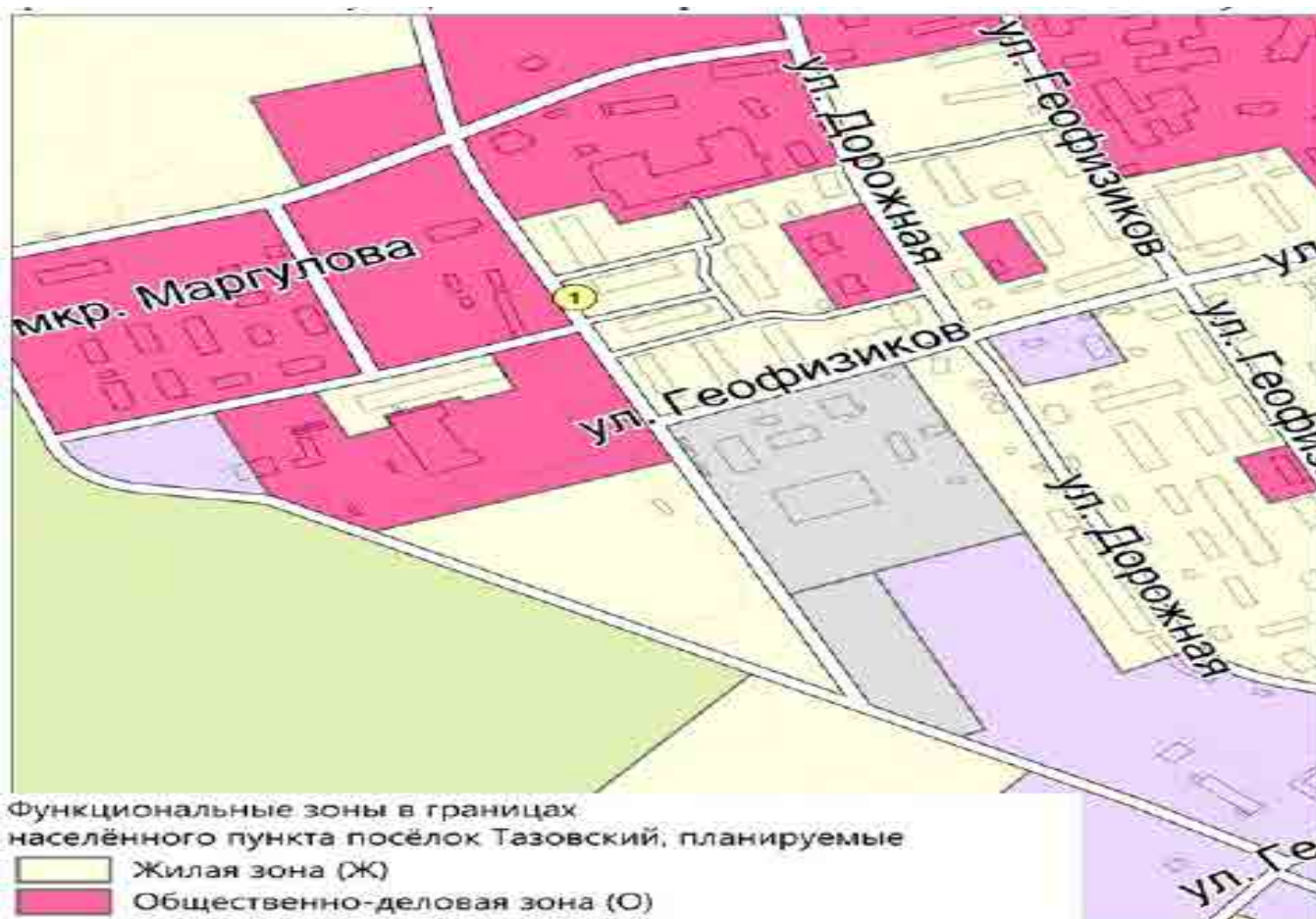
Функциональные зоны в границах населённого пункта посёлок Тазовский, планируемые