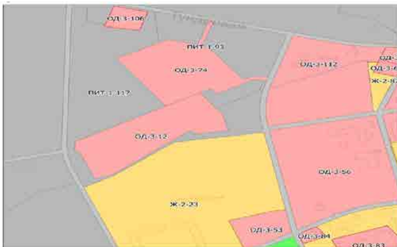
Схема изменения вида и границ территориальной зоны Карты градостроительного зонирования Карты зоны с особыми условиями использования территории

Приложение №3 к решению Собрания депутатов муниципального образования поселок Тазовский от 28 апреля 2020 года № 8