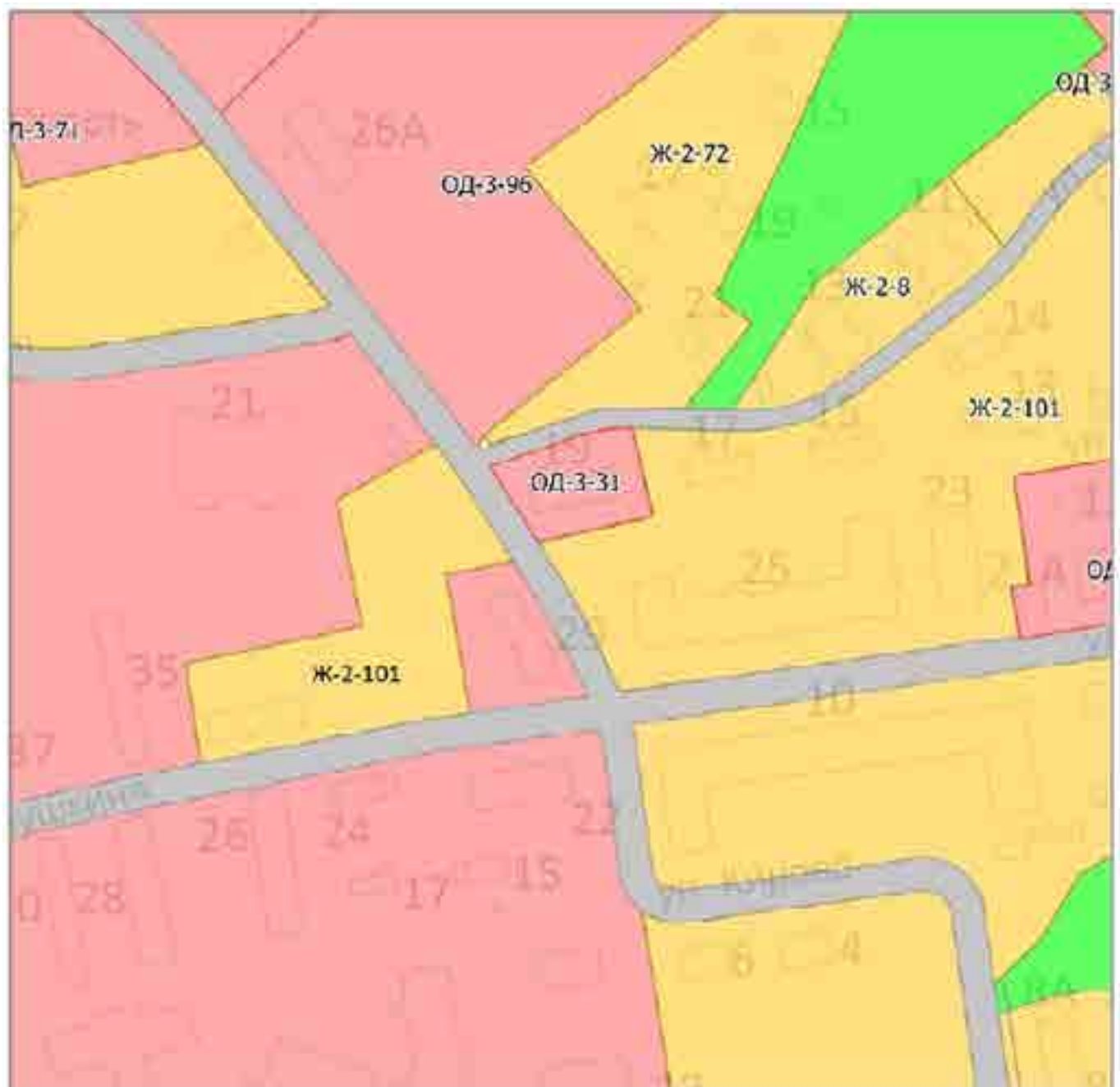
Схема изменения вида и границ территориальной зоны Карты градостроительного зонирования Карты зоны с особыми условиями использования территории

Приложение №2 к решению Собрания депутатов муниципального образования поселок Тазовский от 28 апреля 2020 года № 8