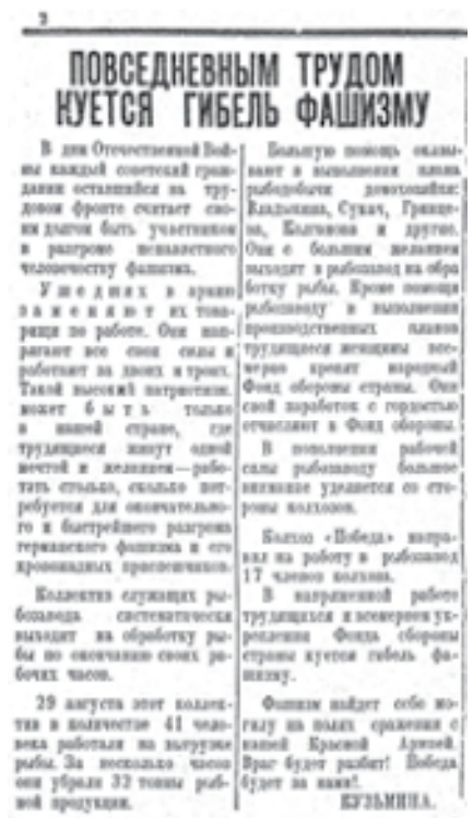
Из газеты «Нарьяна Вы» («Красная тундра») № 62 от 4 сентября 1941 года