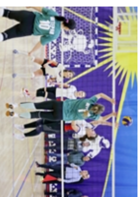
Матч между командами «Огнеборец» и «Ветеран» подарил зрителям невероятный сюжет

Практически каждый матч женского волейбольного турнира в зачёт XX Спартакиады трудящихся района держал в напряжении до последнего розыгрыша. За это зрители и любят волейбол. Но, может быть, если бы участвовало больше команд, то красивых атак, и невероятных спасений, и незабываемых камбеков случилось бы больше. Проведём зачёте XX Спартакиады трудящихся района после волейбольного турнира на первое место выехала команда «Ветеран», второй командой «Спортивная школа» «Огнеборец», третьей место у «Спортившкола».