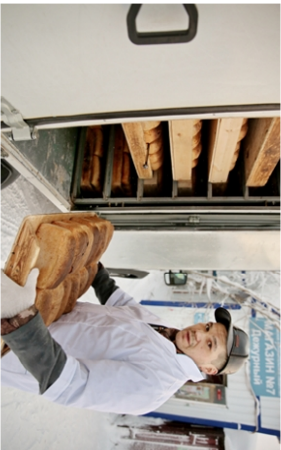
Развозить хлеб ра-ботники хлебоза-вода начи-нают ран-ним утром, когда большин-ство из нас еще видят сны, чтобы к завтраку в магази-нах и на столах был све-жий хлеб. В первую очередь белые и серый до-ставляют в школы, детские сады и больницу